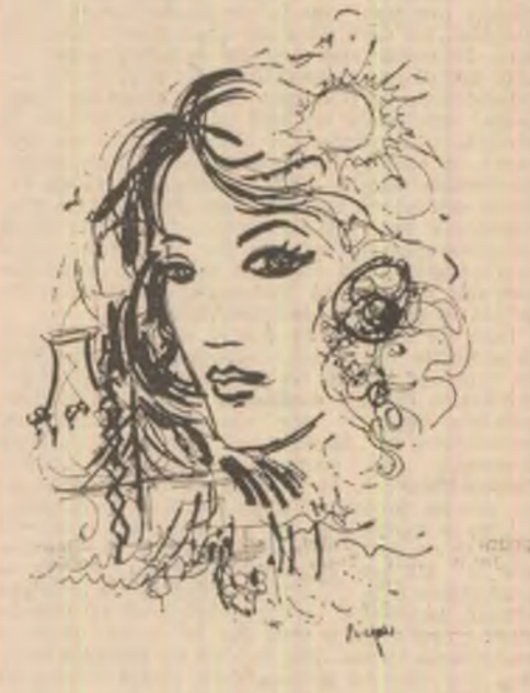
Desen de Mihaela Negru

la doi ochi odată un măr cu tot și cu totul — din aur...”