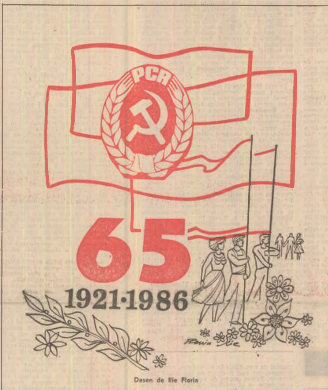
Desen de Ilie Florin