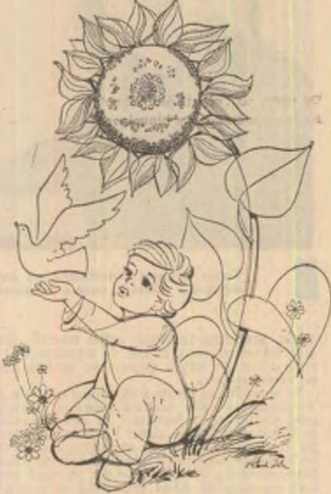
Desen de Ilie Florin

Intr-o dimineață fui meu mi-a spus de îndată ce a deschis ochii: „Mamă, tu ești o țară!”