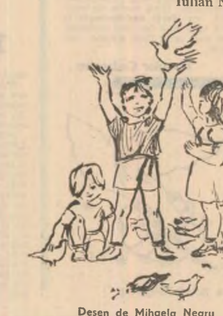
Desen de Mihaela Neagu