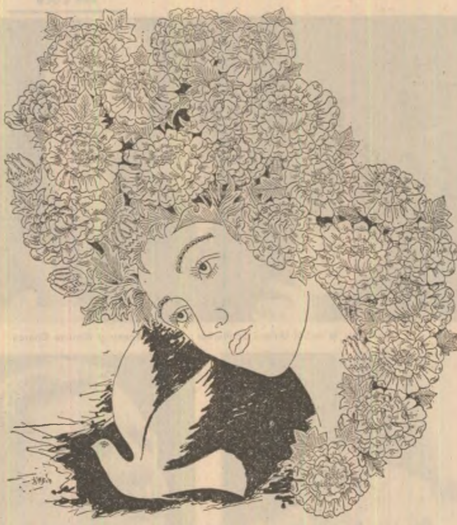
Desen de Sabin Ștefănuț

din strănătate. Costă circa 4 000 de dolari. Noi am reușit să obținem o variantă imbunătățită.