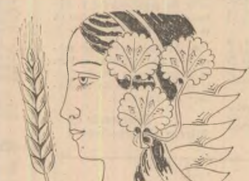
Desen de Sabin Ștefănuță

Prezentare și traducere de Valentin Negoităș (Fragmente din romanul „Surorile Makioaka”)