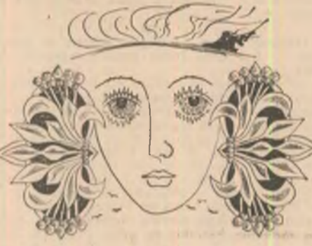
Desen de Sabin Ștefanuș

munții înșurîți ca soldații în repaus apele — ca niște cîngători țara-i o roată țara-i o horă jucată de seculari jucători mese cu bucatele întinse — cîmpile dealurile — desași încărcați aici ne e casa — Patria în care energiile ne urcă la rang de Carpați l