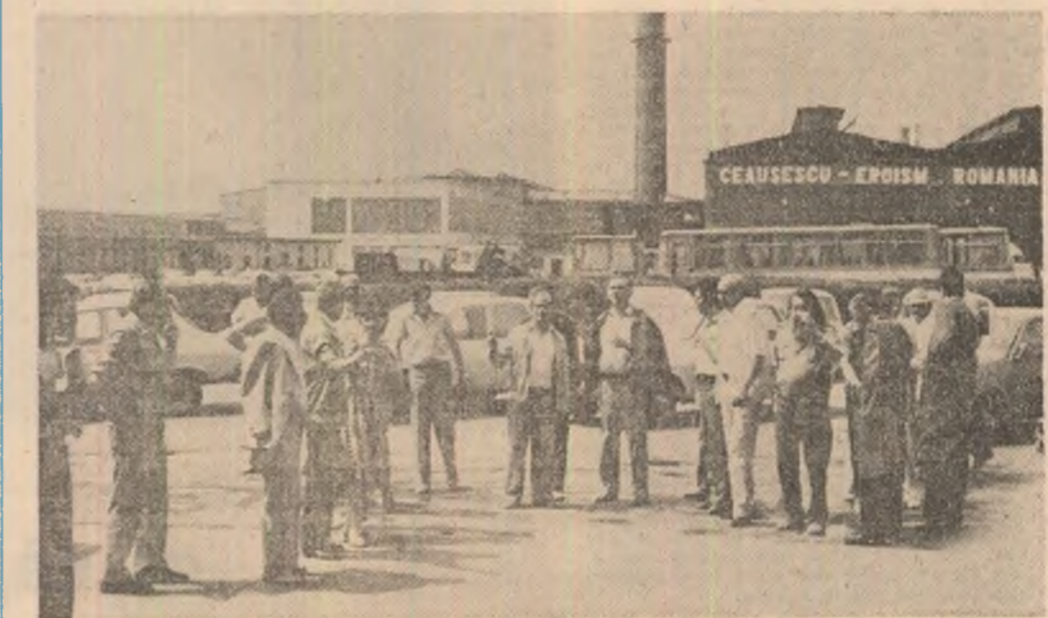
Viită de documentare a unui grup de scriitori într-o mare întreprindere