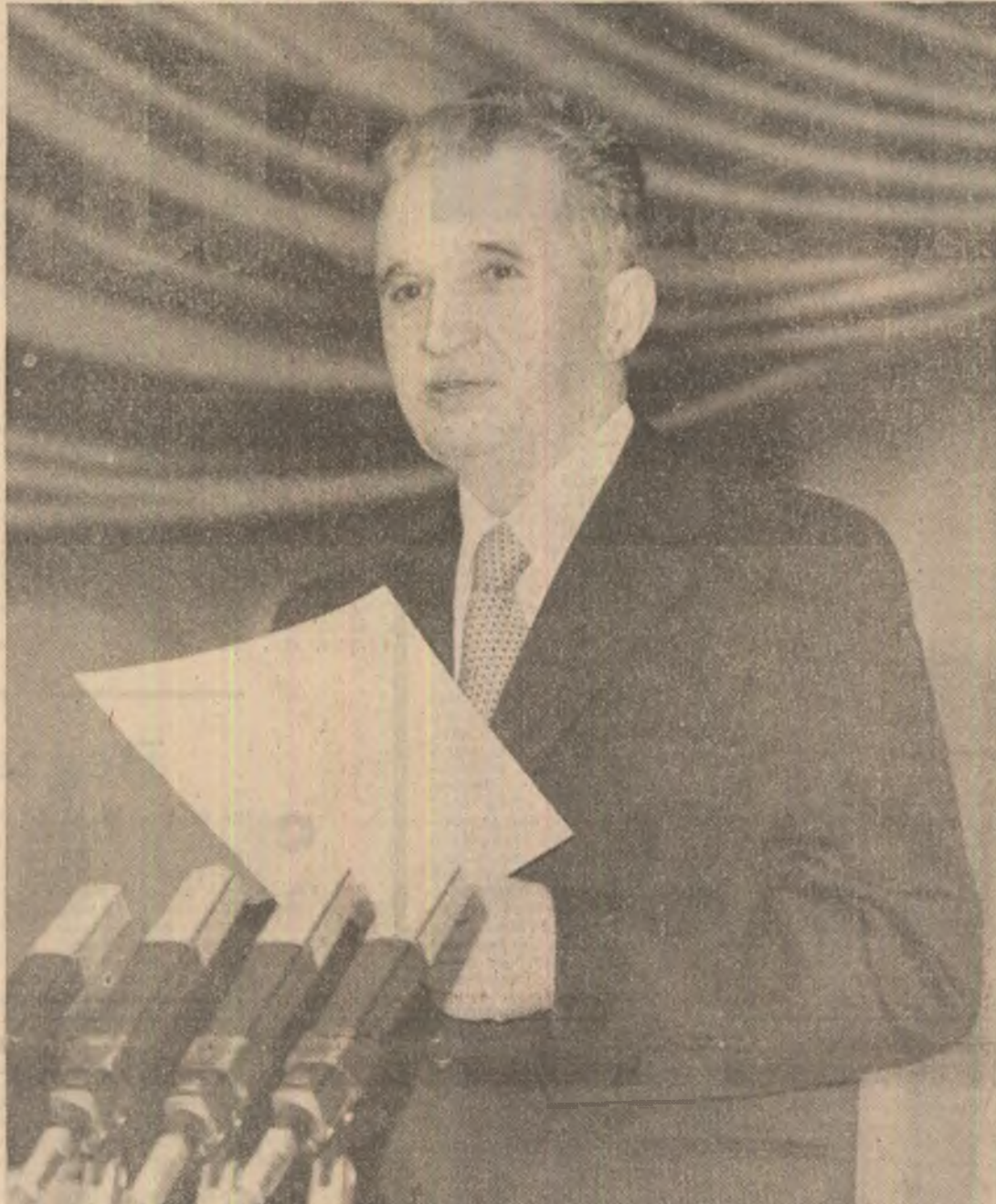
Tovarășul NICOLAE CEAUȘESCU a rostit o importantă cuvîntare la Plenara lărgită a Consiliului Național al Agriculturii, Industriei Alimentare, Silviculturii și Gospodării Apelor, cuvîntare care se constituie într-un larg program de acțiune pentru dezvoltarea acestor domenii.