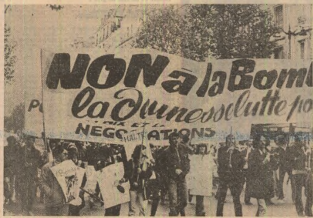
Amplă manifestație pentru pace la Paris