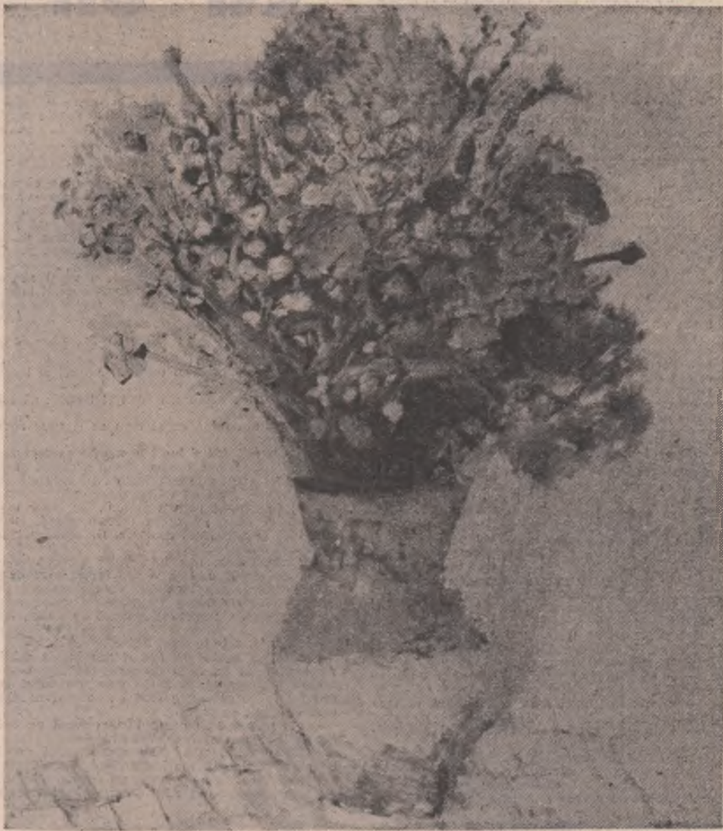
Teodor Bogoi - «Flori»