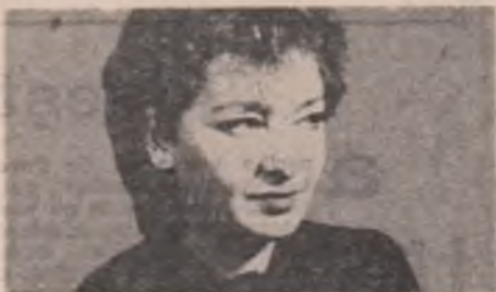
Te-adună în palmele mele firești, Pustiul de vorbe ale vechii dîinii, Teama de ziua cu ochii deschîși.

Mi-am înmuat privirea într-un adînc de mare În gîndurile mele s-au scurs tot mai adînc Plutînd prin reveria albastrului rotund Ca un ecou fantastic la propria chemare.