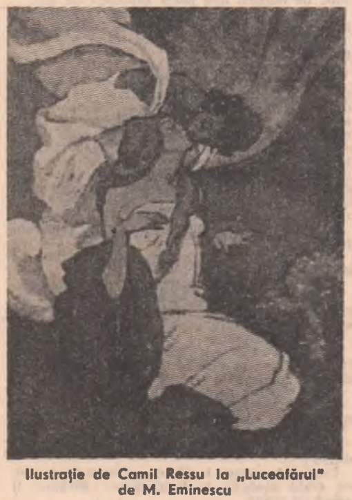
Ilustrație de Camil Ressu la „Luceafărul“ de M. Eminescu