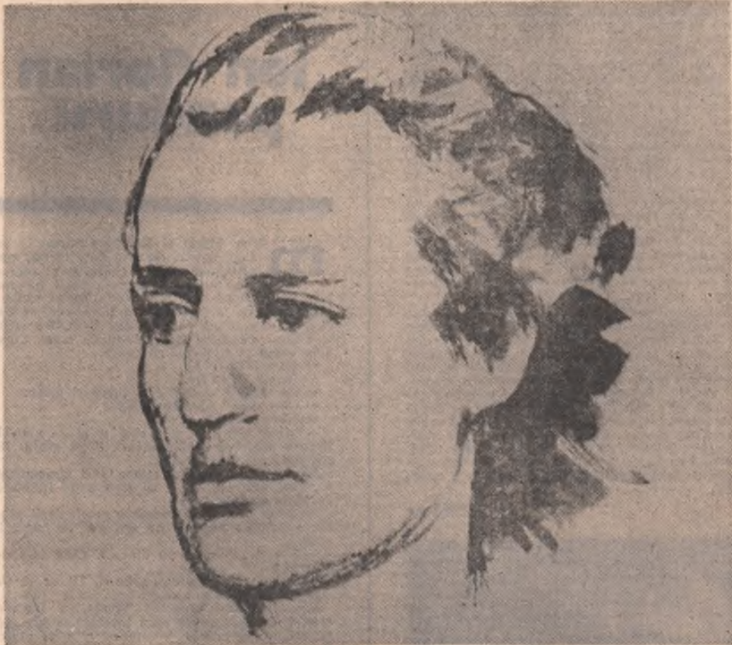
EMINESCU - desen de Corneliu Babo

atunci când vorbea despre poezia lui Eminescu profesorul de limba română avea obiceiul să ne întrebe: „Voi nu simțiți dogoarea versului eminescian?“