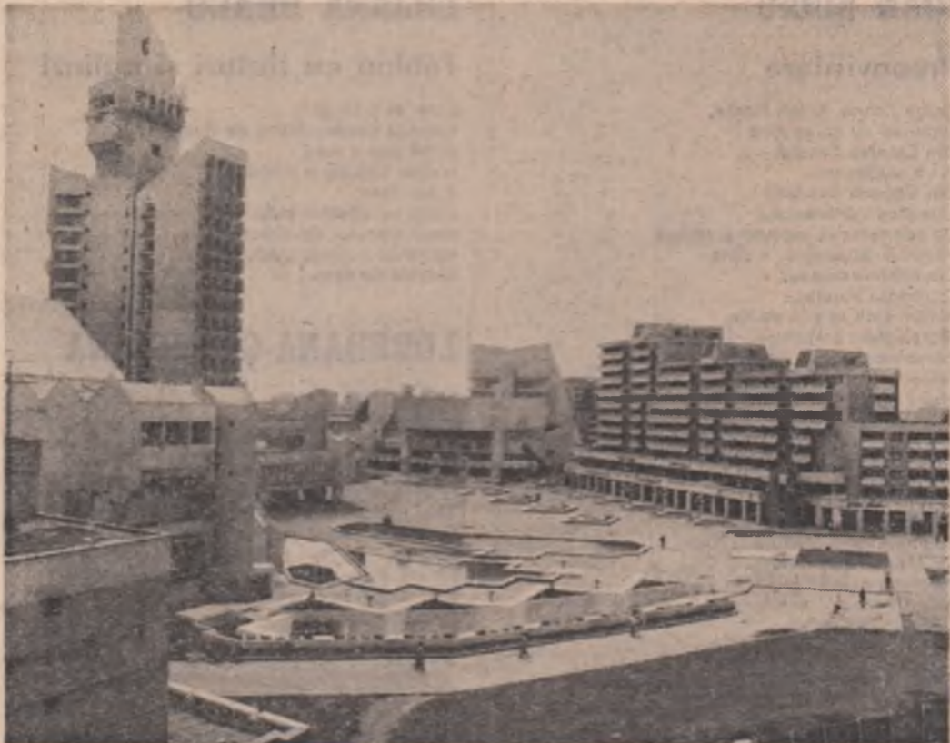
Arhitectură modernă la Satu Mare