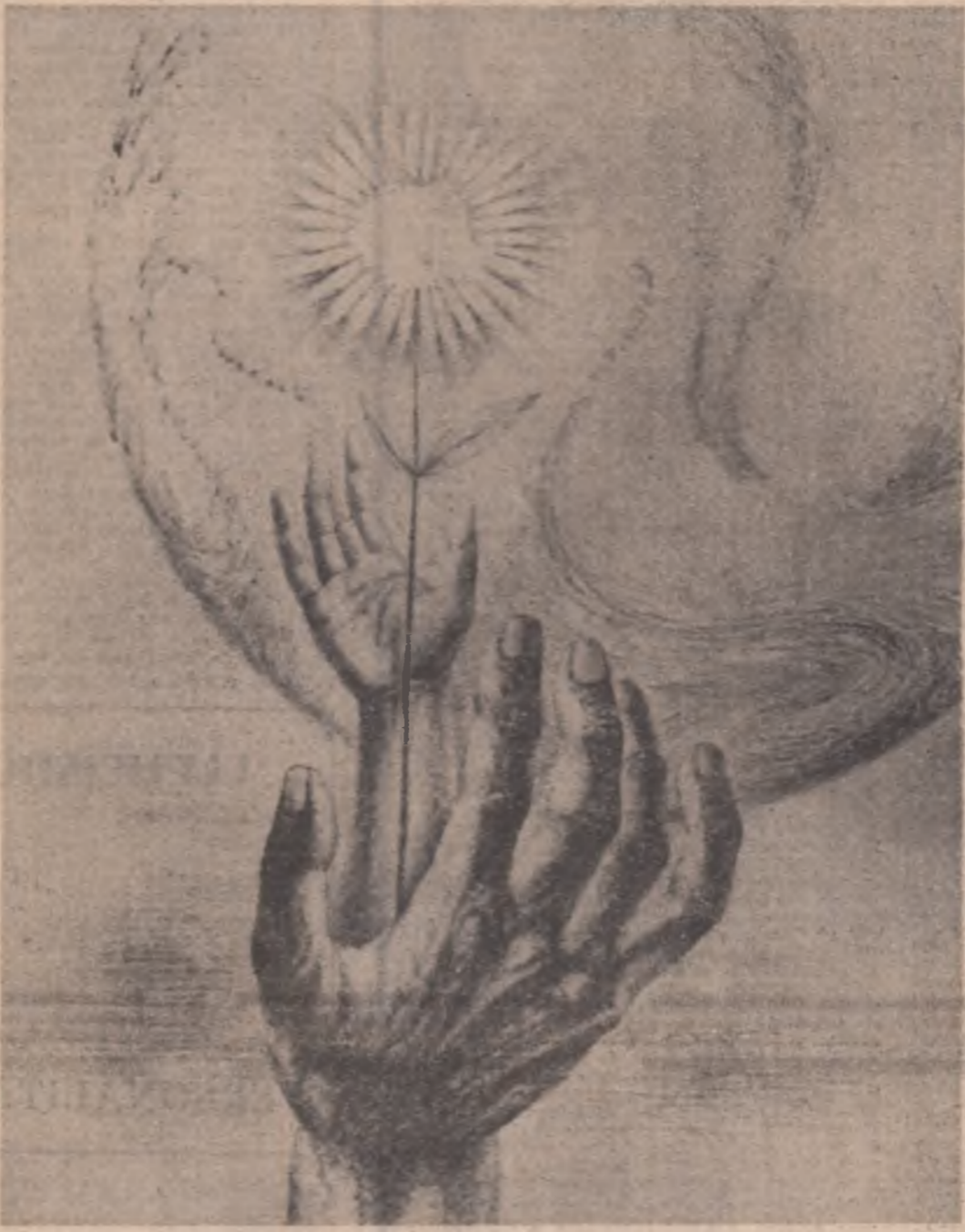
Csotak Levente: „Geneză”