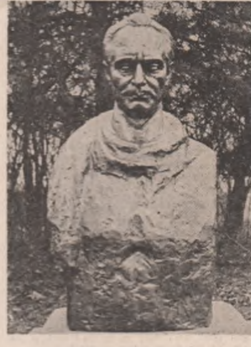
Sculptură de Mihai Coșan

vin memorabile: rolul „epocal” al lui Argehi „în remodelarea limbii”; în micile poeme barociene vibrează „tonuri sfîșietoare”; „dionisiacul, astralul și geometrul” Ion Barbu; romanele lui Rebreanu îmbogățesc literatura „cu primele” opere „realiste de forță incontestabilă și de o deschidere fără precedent”, Ion fiind „un adevărat muzeu național”.