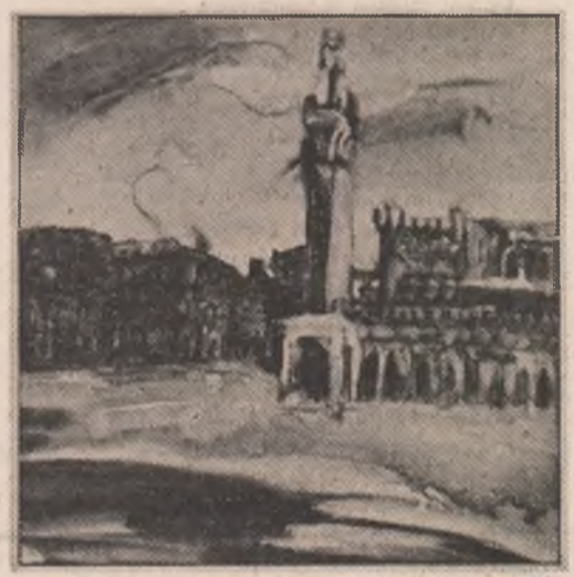
Tablouri de Viorela Mihăescu