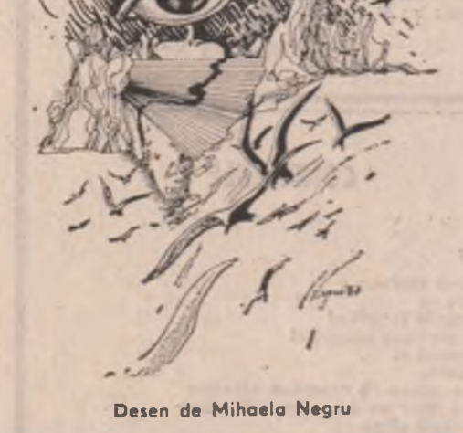
Desen de Mihaela Negru