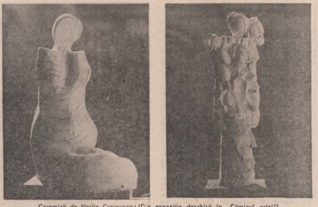
Ceramică de Vasile Crovoianu (Din expoziția deschisă la „Căminul artei”)