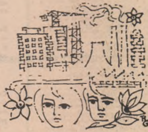
Desen de Raluca Grigoreca

Carola cerului ne luminează — Inima se deschide spre tine, Patrie, ca o carte.