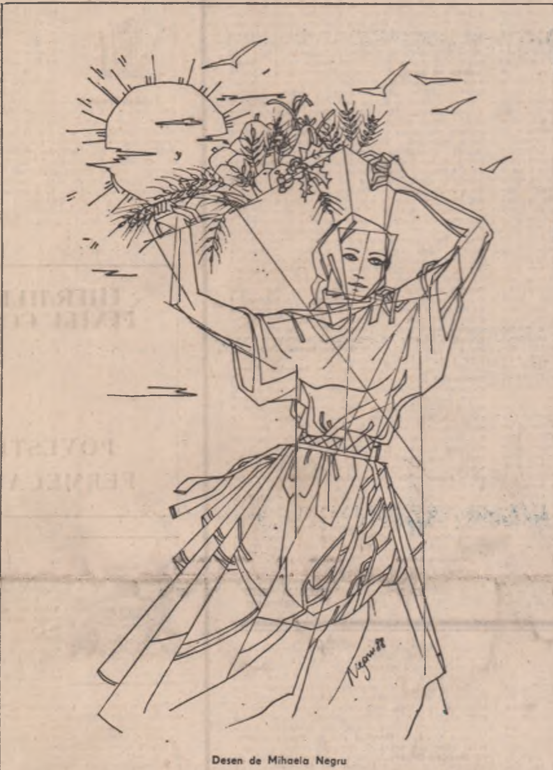
Desen de Mihaela Negru