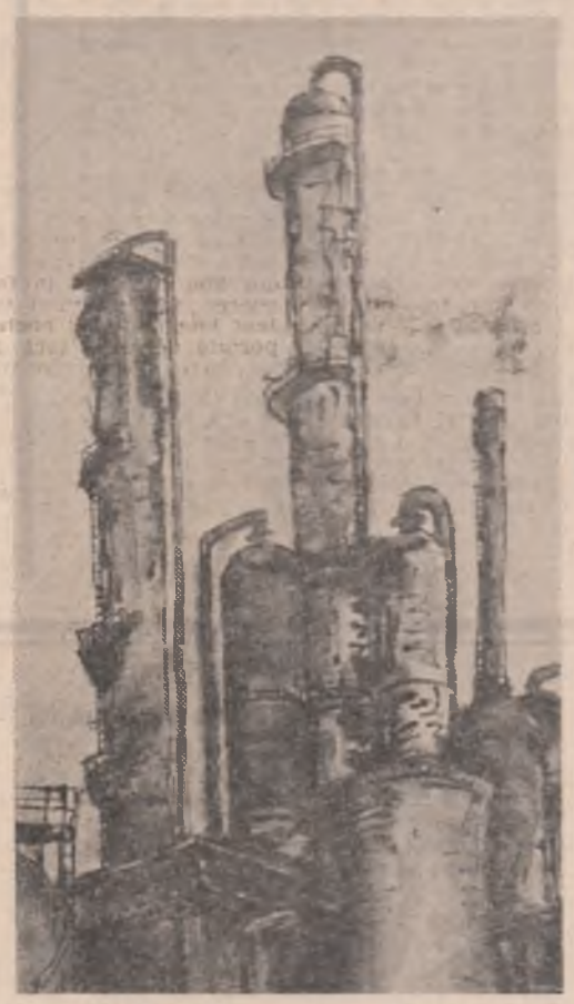
Otto Borabas-Teleajen: „Peisaj industrial”