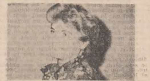
Tablouri de Petre Preda Constantin din expoziția deschisă la Teatrul Foarte Mic

chiam poemul aruncînd insemel frîmțurii din mine și el venea din ce în ce mai des pînă cînd n-a mai rămas nimic decit un punct mișcător pe o bucată de hirtie