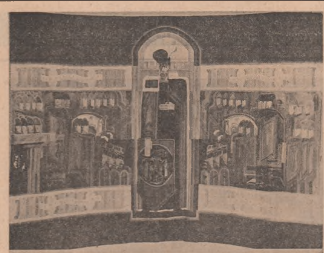
Tapiserie de Ileana Balotă

Ediția Sport-Turism a apărut un frumos micro-album despre Arad cu un avizat cuvînt înainte semnat de Crăciun Bonta.