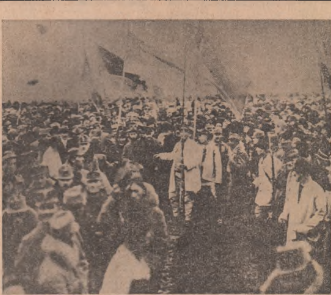
1918. Marea odonore populară de la Alba Iulia