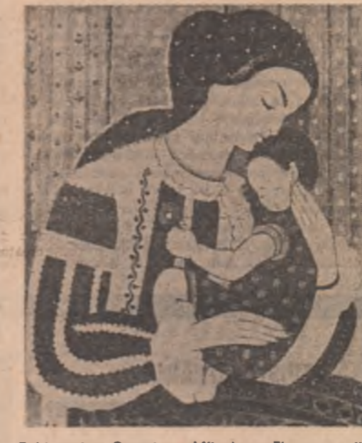
Tablou de Octavia Milculescu-Florescu din expoziția de la Galeria de artă a municipiului

O îmbrățișare a fenomenului literar din anul primului război mondial ne scoate la iveală în primul rînd o mare cantitate de discursuri și articole de ziar: acestea însă ies din limitele speciei propriu-zis inscriindu-se, prin realizarea artistică, prin patetismul afirmației, prin adevărul îmbrăcat în bainele frumosului — în sfera literaturii; sînt literatură de cea mai bună calitate. Lor li se adaugă reportaje, poezii patriotice, iarar care și satirice și pamflete la adresa înamicii care, în einismul lui, folosea mijlocul de luptă din afara convențiilor internaționale. Totul avînd un singur scop: mobilizarea sufletelor, întărirea încrederei în victorie. În spațiile victoriilor românești din primul război mondial se află, putem zice în deplină conștiință de cauză, și cuvîntul care a împins cu aripile lui largi trupele dîndu-le elanul din sine, scoarîndu-l adine în consiliu la fiecare pas pînă la găsirea identității cu toți deopotrivă. Numele din spatele cuvîntului, numele celor care l-au purtat, au rămas pentru todeauna zidite la temelile actului de la 1 Decembrie 1918. Pe cîteva dintre ele încercăm, în limita spațiului, să le readucem, împreună cu cuvîntul lor, în paginile de față.