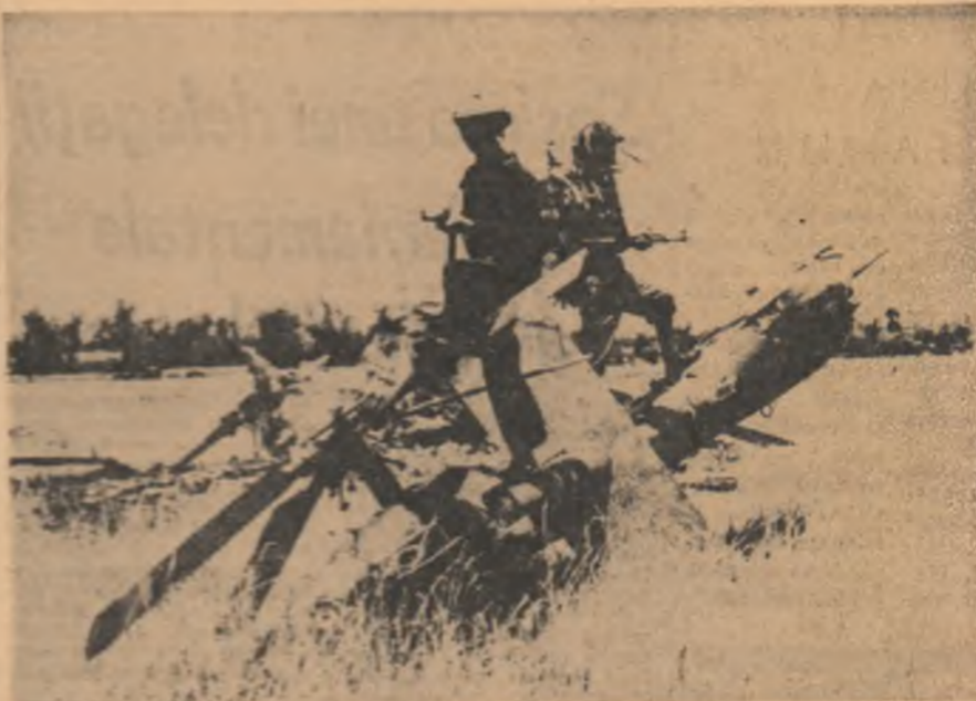
VIETNAMUL DE SUD. — Încă un avion american doborât de forțele patriotice