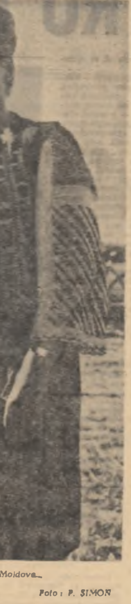
Trandafir de la Moldova...

La sonda 911, aparținând Institutului de foraj Craiova, a intrat în funcțiune, cu un program de mare adâncime, instalația de foraj 4 DR-315.