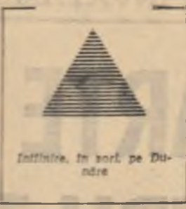
Infinitiv, în sorb, pe Dindrie

Pe lângă filmul științific prezentat și la Budapesta în cadrul unui congres internațional de chirurgie.