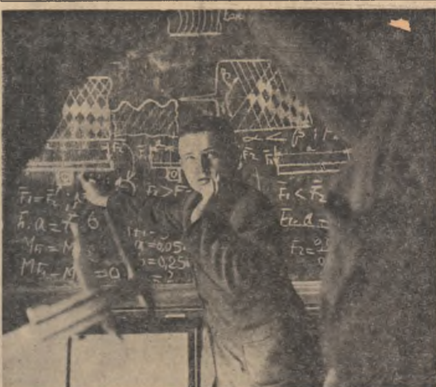
Spre profesia de mecanic agricol, drumul trece și prin atelierul de lăcătușerie (săle de instruire practică la Școala profesională din Bărcănești, regiunea Ploiești)