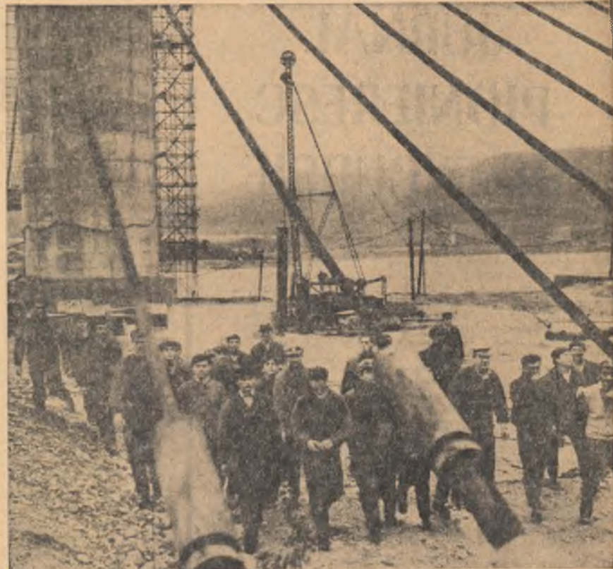
Si-a pornit din Craiova un adevărat tren al veseliei. (jos) Peste oțeva ore, cea dintîi cunoștință au șantierul (sus)