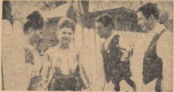
„Băieții au coborît de pe cal și au bătut la porți. Fetele le-au ieșit în întîmpinare. La invitația lor politicoasă de a participa împreună cu ei la Festival, n-au mai stat nici o clipă pe gînduri.

De la Comitetul regional Ploiești al U.T.C. am primit o invitație lapidară: „In regiune are loc Festivalul cultural artistic și sportiv al tineretului — Iaza a II — pe centre. Vă rugăm să luați parte”.