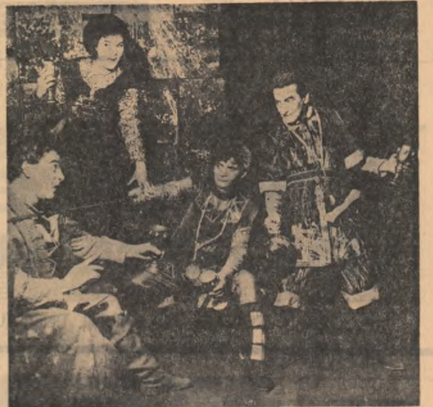
Scenă din „Viforul” de B. Șt. Delavrancea pe scena Teatrului Național din Cluj.