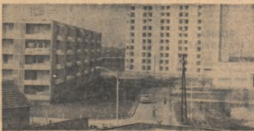
În construcție la Oradea