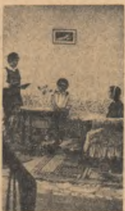
Aspect în houlul Școlii agricole din Șimleu