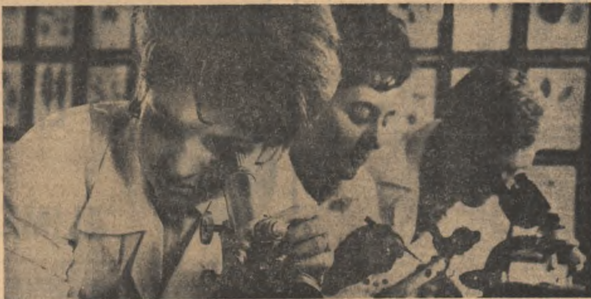
Studentii Universității crolvene în plină activitate