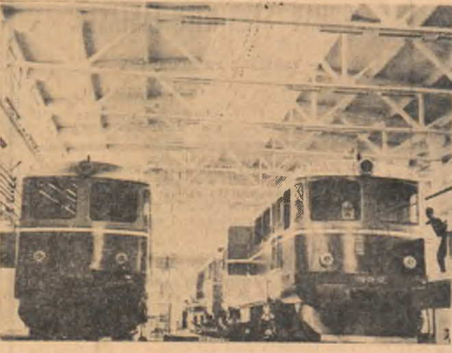
Noua hală de reparatii și revizii curente dată în folosință în acest an la Depoul G.F.R. București-Triaș.