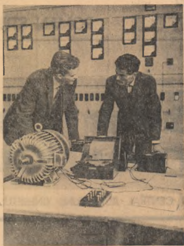
In laboratorul de mașini electrice al Institutului politehnic din Cluj

Așadar, majorarea se va aplica acestei pensii și nu salariului în baza căruia ea a fost stabilită. Și, intracîtu cî cuantumul pensiei este sub 400 lei, soția va primi o pensie de urmaș majorată cu 40 la sută.