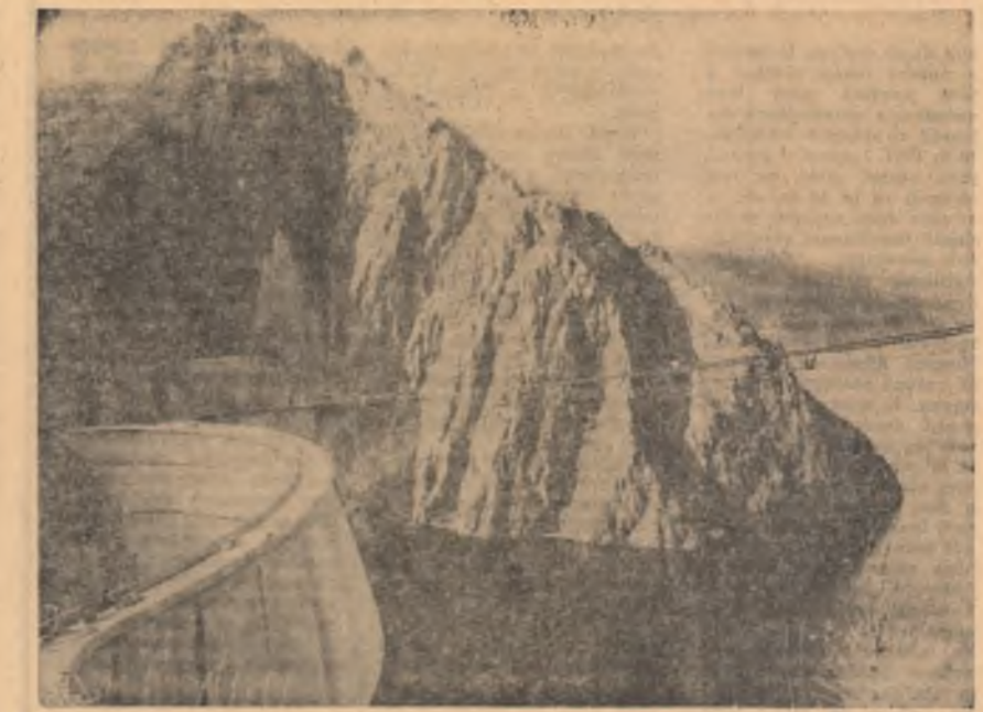
Barajul hidrocentral Gheorghe Gheorghiu-Dej de pe Argeș.