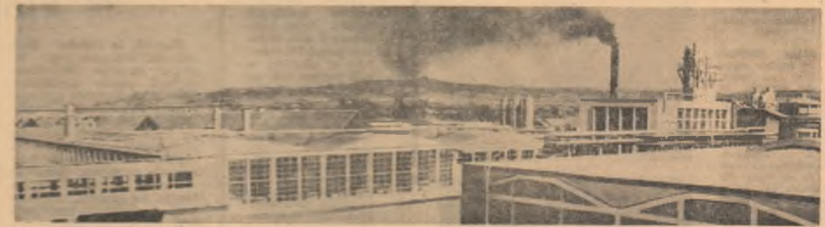
Vedere exterioră a C.I.E.-ului din Turnu Severin

INTERIEU (de la corespondentul nostru). Încercările pregătitoare la vederea construcției unei noi poli-clinici moderne au început de curînd în orașul Știința. În locul actual al acestui obiectiv sanitar cu parter și două etaje vor funcționa peste 25 cabinete de specialitate dotate cu aparatură modernă ce va asigura anual un număr de consultații care vor depăși cifra de 600.000.