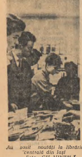
Au sosit noulți la librăria centrală din Iași.