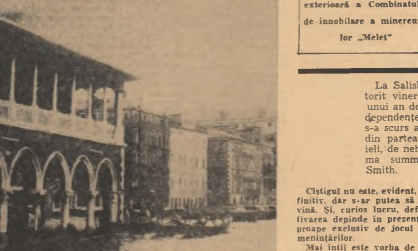
În urma inundațiilor care au avut loc în Italia au fost avariate șosele rurale pe o distanță de 5.000 kilometri și aproximativ 800.000 hectare pământ arabil. Totodată, a fost distrusă parțial 12.000 ferme agricole, 24.000 plantații, 16.000 mașini agricole. Cei privește șeptelul, au fost pierdute 50.000 capete bovine. În fotografie: Canalul Grande din Veneția după recente inundații