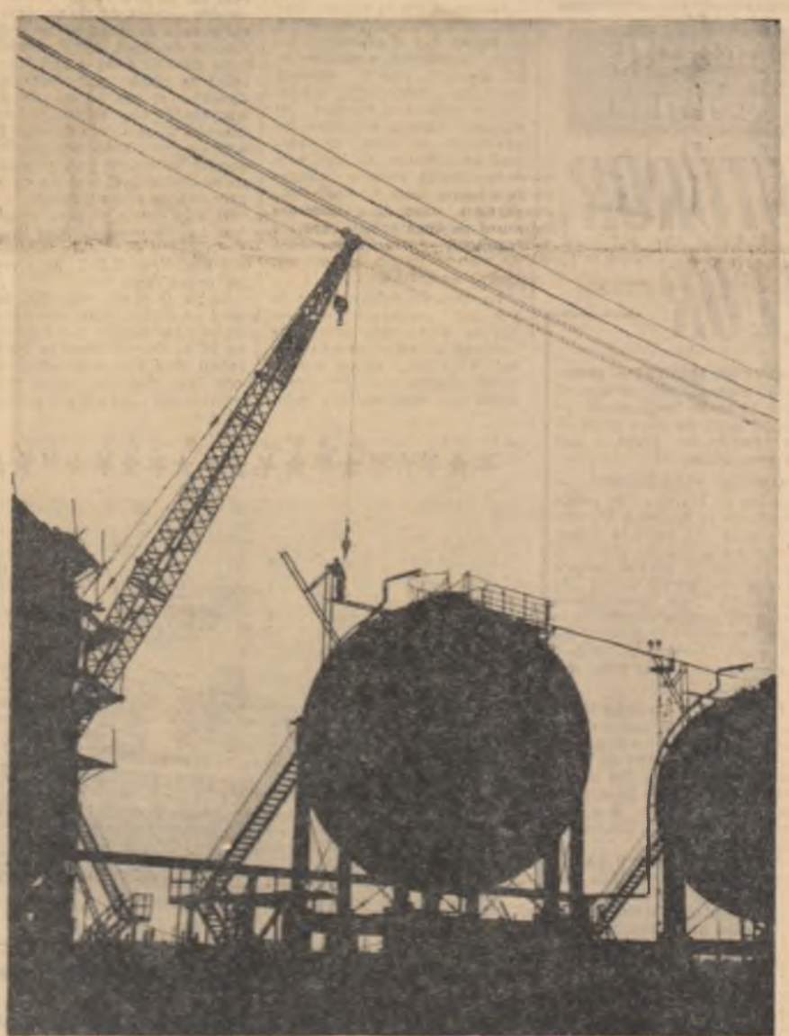
Construcțiile industriale din cadrul Complexului petrochimic Brașov cresc de la un an la altul ca... brazii. Brașul puternic și modernul „șeză” pe platforma noile rezervoare steric.

Imaginea, de atâtea ori amintită a uzinei și șantierului care fac corp comun, este prezentă și la Tr. Măgurele. Combinatul de îngrășăminte chimice numără acum 9 fabrici iar în perimetrul lui, alături de acestea, constructorii stăcă altele.