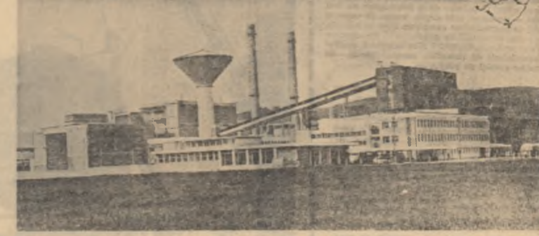
Fabrica de produse retractorice din Alba Iulia