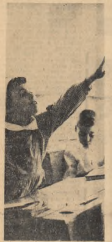
Știu toată lecția! (Instantaneu de la Școala generală nr. 174 din Capitală)

continuă schimburile de delegații și de experiență în diferite domenii de activitate.