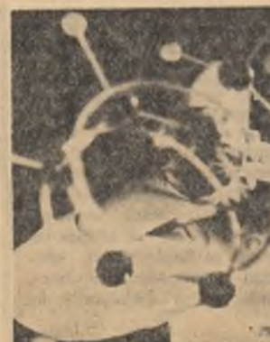
Oră de laborator la Institutul pedagogic de 3 ani din Tg. Mureș