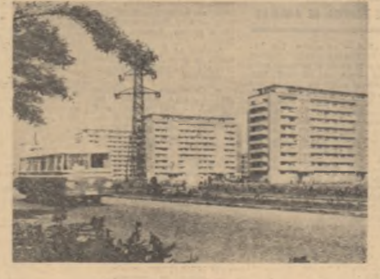
Și noi construcții în cartierul Ploiești-Nord

PITEȘTI (de la corespondența noastră) Ultima de alumina Slatina a livrat Combinatului chimic din orașul Victoria primele tuburi de alumina necesare instalațiilor de distilare a acidului azotic.