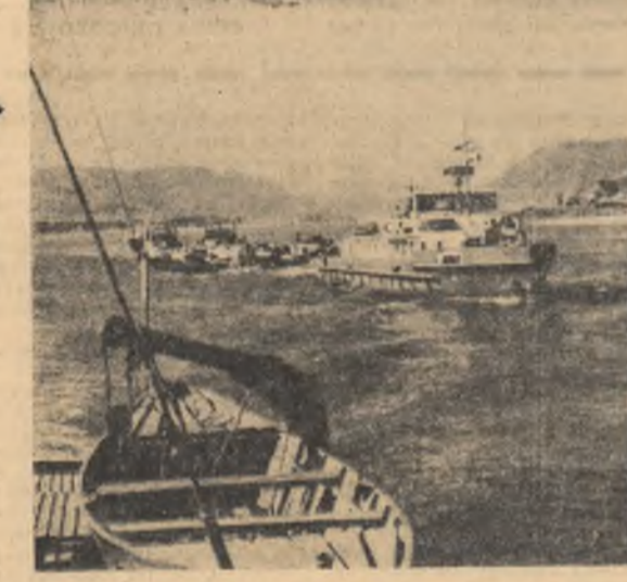
„Scintela tineretului” (Continuare în pag. a III-a) Pe valurile Dunării

Investite cu încrederea cadrelor U.T.C. și A.S. organelor noi alese, în componenta căror au fost promovați studenții fruntași la învățătură și în activitatea obștească, cu dragoste și pasiune pentru munca de organizație, le revin, în mod firesc, în îndeplinirea acestor sarcini, obligații și răspunderi deosebite. Ele sînt chemate să organizeze și să conducă întreaga muncă a organizației, să coordoneze și să orienteze eforturile colectivelor de studenți spre realizarea practică a sarcinilor, a planurilor de activități adoptate în adunările generale și în conferințe. Și este de la sine înțeles, activitatea fiecărui organizat poate oferi destule dovezi — că succesul în această privință depinde într-o bună măsură de priceperea și experiența, de calitatea muncii celor care au fost aleși în organele de conducere ale organizațiilor U.T.C. și ale asociațiilor studenților.