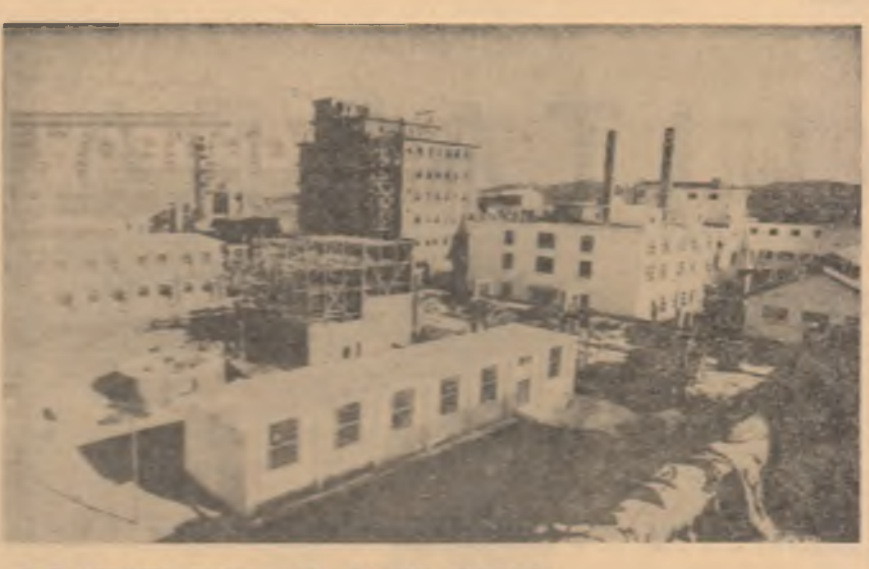
R. P. ALBANIA. Vedere a unei noi unități industriale: Fabrica de sodă anionică din orașul Vîșje.