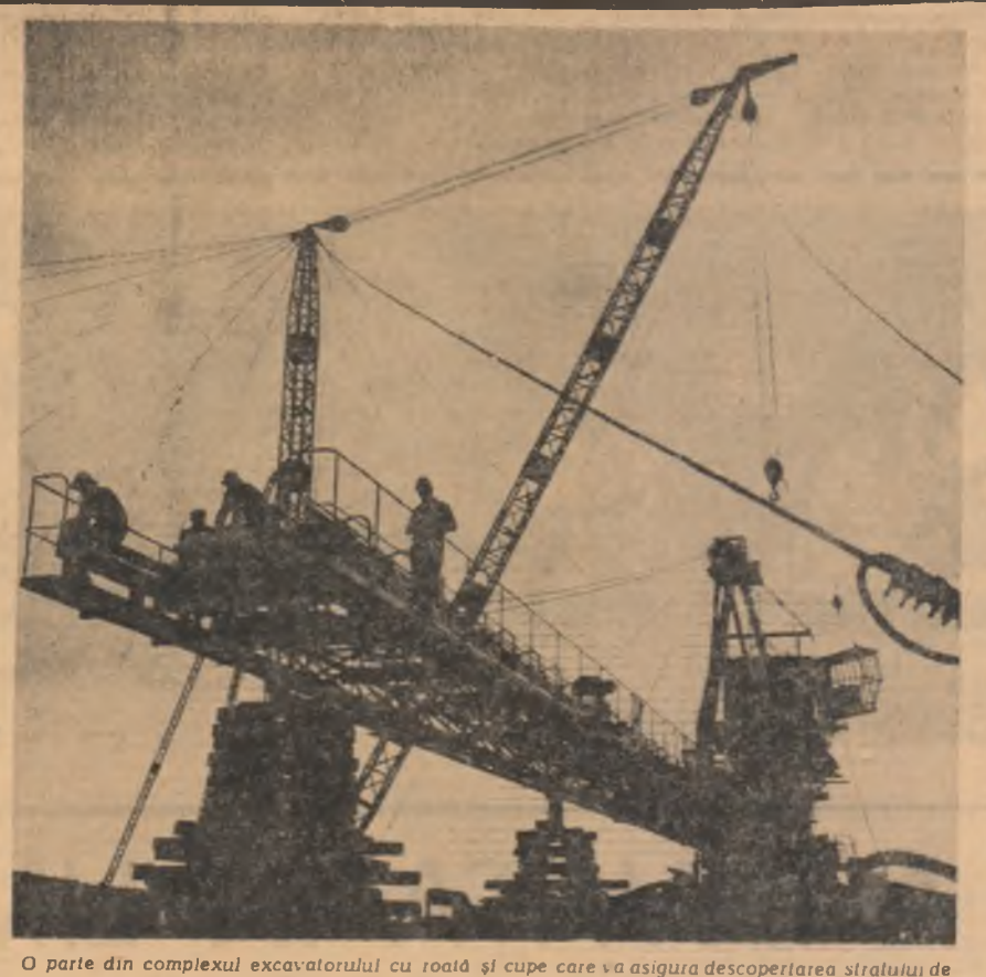
O parte din complexul excavatorului cu roată și cupe care va asigura descoperirea stralului de cărbune de la exploatarea minieră Rovinari.