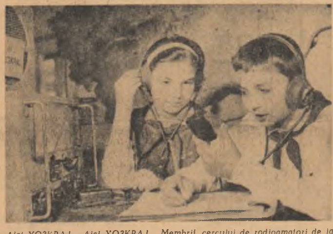
Aici YOJKPA!... Aici YOJKPA!... Membrii cercului de radioamatori de la Palatul pionierilor transmit pe diferite lungimi de undă legîndu-și prietenii în țară și peste hotare.