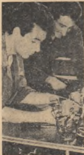
Întreprinderea industrială de stat „Automatlea”. Se lucrează la tabloul de comandă pentru instalația de încălzit și iluminat vagoane de căldură

● Fabrica „Sinteza” Colectivul Fabricii chimice „Sinteza” din Oradea a îndeplinit, primul în regiunea Crișana, planul anual la producția globală și marfă. Acest succes se datorează măsurilor complexe luate pentru introducerea pe scară largă a mecanizării unor operații și asimilării de noi sortimente, printre care: bromura de etil, esterul etilic al acidului acetic, bromura de metil și carbotoxul. ● Exploătarile Arșița și Nepomiceeni Exploătarile Arșița și Nepomiceeni, din cadrul Întreprinderii miniere Vatra Dornei, au anunțat, încă de la 26 noiembrie a.c. îndeplinirea sarcinilor anuale de plan la producția globală industrială și marfă. Până la sfârșitul anului, se prevede o depășire de circa 7000 tone minereu mangan. ● Fabrica „Rarăul” Fabrica de lăpte „Rarăul”, a comunicat, de asemenea, îndeplinirea planului pe întregul an, cu mai mult de o lună înainte. ● La Porțile de Fier Citeva colective din cadrul șantierului de la Porțile de Fier anunță îndeplinirea înainte de termen a sarcinilor care le-au revenit în cadrul planului anual. Unul din ele este colectivul care lucrează la excavații în incinta bătărilor în celular în vederea turnării betonului la eluce și centrală. El și-a îndeplinit sarcinile anuale încă din luna octombrie. Sarcinile planului anual au fost îndeplinite și de colectivul de la șantierul Virciorova.