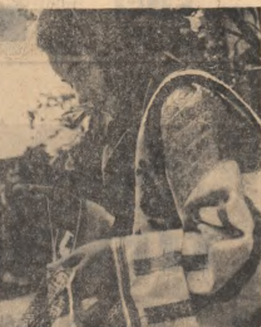
Alegndă în cu fir, la nașterea minunatele motive oltenite!

În legătură cu aceste neajunsuri existente în organizarea sistemului de distribuție am stat de vorbă cu mai mulți cetățeni, care au făcut propuneri în completarea observațiilor tovarășului Marinescu, și care se impun a fi luate în seamă de furnizorii în drept.