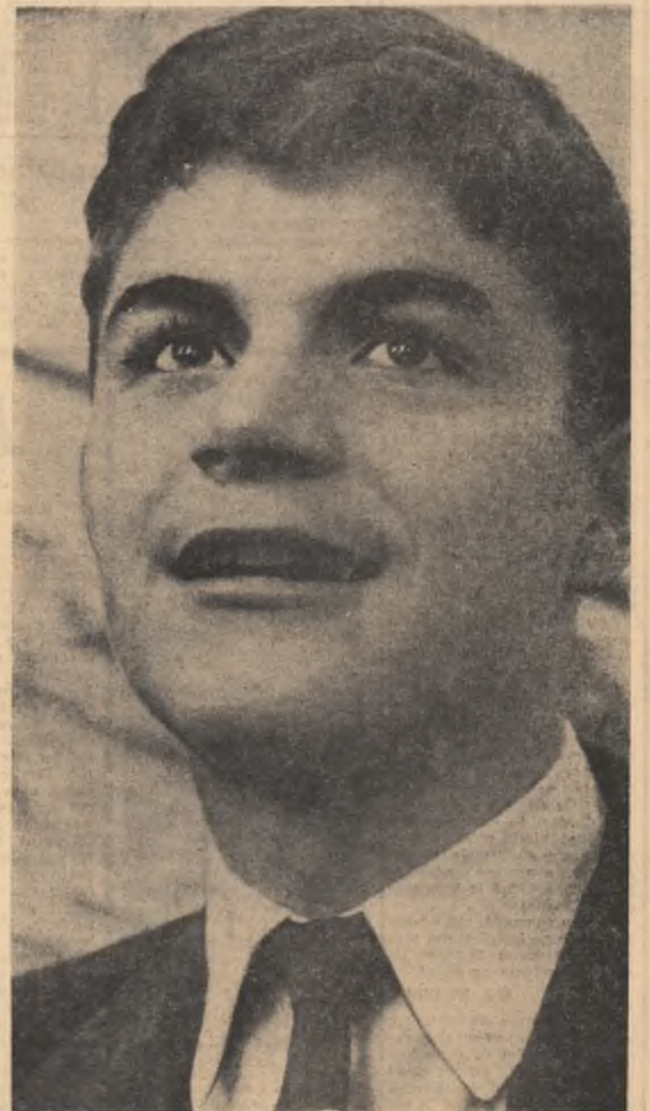
În pragul majoratului