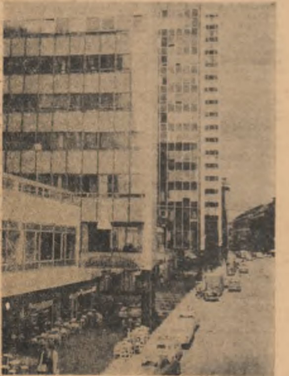
SUEDIA. Pe o stradă din Stockholm