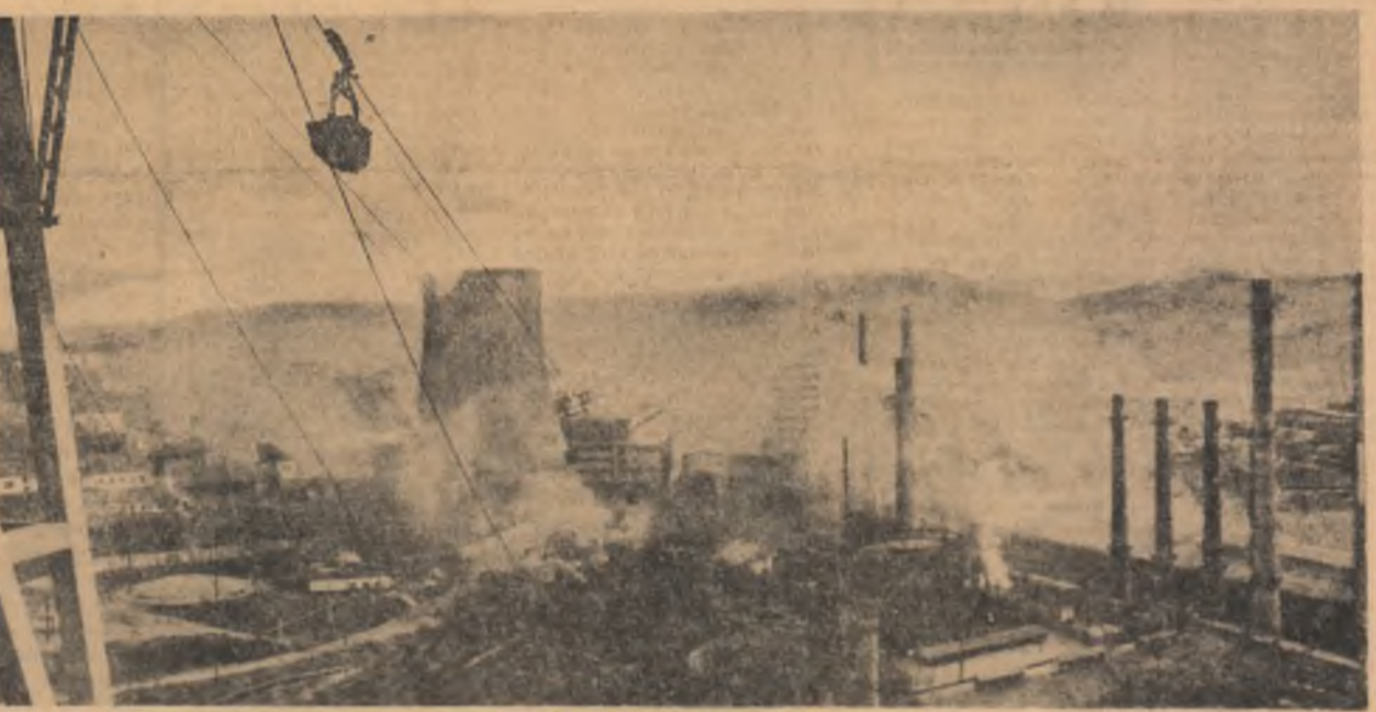
Peisajul industrial al Reșiței