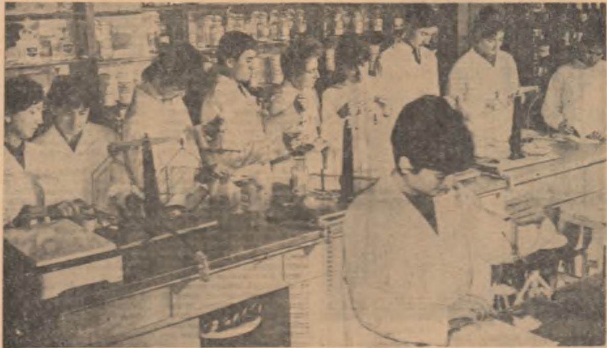
Ord de instruire practică pentru elevii anului I, secția farmaceutică, de la Grupul școlar sanitar București