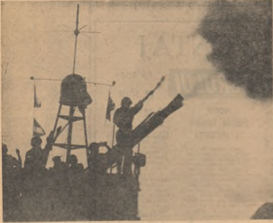
R. D. VIETNAM. De străji granițelor maritime ale țării