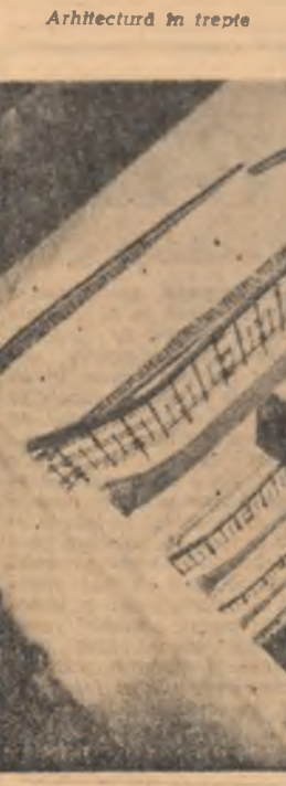
Arhitectură în trepte