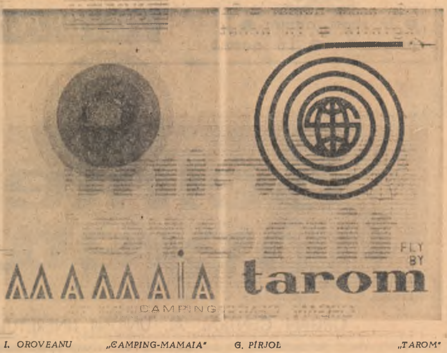
I. OROVEANU „CAMPING-MAMAIA” G. PIRJOL „TAROM”