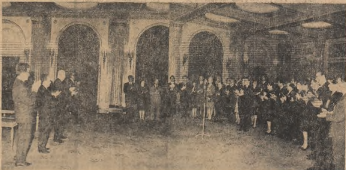
Aspect din timpul solemnității înmînării unor ordine și medalii