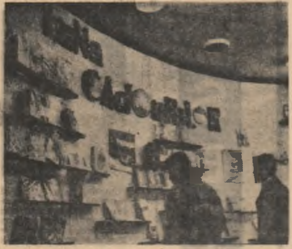
Aspect din bibliotecă „Mihail Eminescu” din Capitală la expoziția organizată în cadrul „Lucrărilor cadourilor”