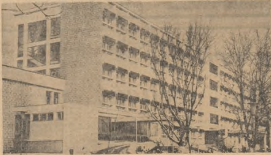
Vedere exterioară a maternității din Bacău