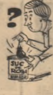
Încercăți burcanele, câmpurile... vârele în viață.