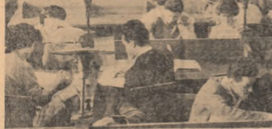
Studiu în biblioteca facultății de drept a Universității București