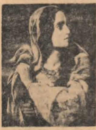
România revoluționară, una din celebrele picturi ale secolului XIX pe care a realizat G. Opreșcu o va prezenta într-un viitor articol

Tot timpul în ceea ce întreprinde el a fost condus de situația pe care o cunoscuse acolo unde învățase, adică de ceea ce era considerat ca necesar culturii artistice la Viena și pe unde mai călătorise. Tendința lui este deci să copieze la București ceea ce fusese considerat util de unde venise. Se ocupă, bineînțeles și de scoala, mai întâi la Craiova, unde se și căsătorise cu o româncă, prin 1821. Tot atunci, el intră în raport cu persoane însemnate din capitala Otomaniei, și începe să dea lecții copiilor din aceste familii. El însă are ambiții mai utile și mai înalte, și în 1829 intră în serviciul Eforiei școlilor din București. Cînd devine chiar profesor la colegiul Sf. Sava.