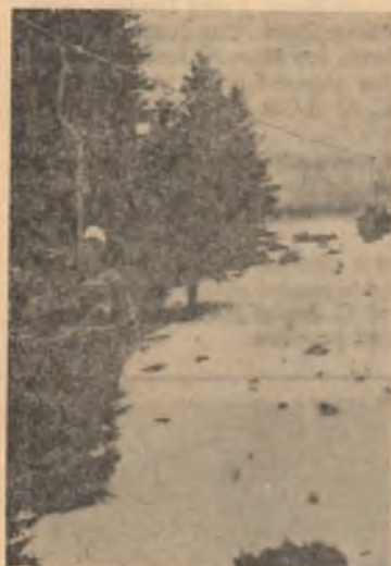
Cu telericul spre Gidbaet