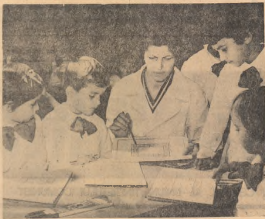
Ord de desen la grădinița nr. 4 din Iași