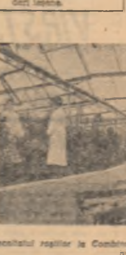
Reședință școlară la Combinatul aploantinar „30 Decembrie”