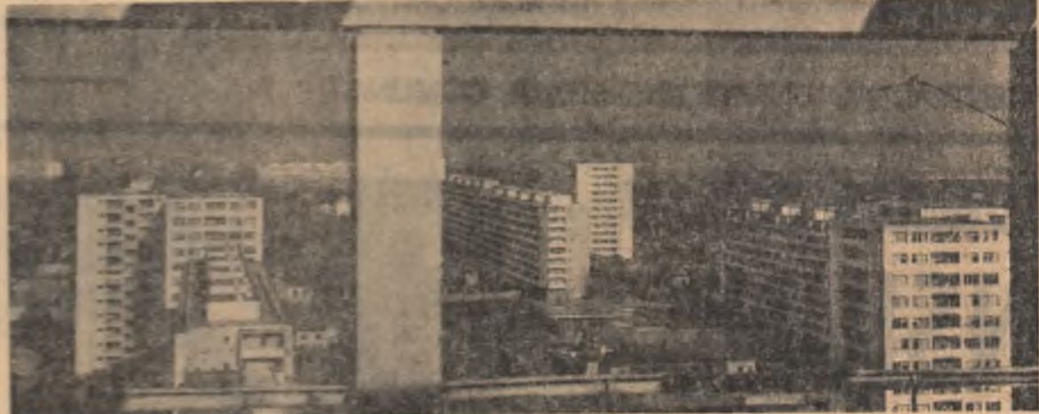
Un aspect de pe Joseava Ciurgăului

*) Vezi nr. 5448 5453, 5455, 5461, 5465, 5469.