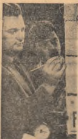
Intr-unul din laboratoarele Politehnicii timișorene