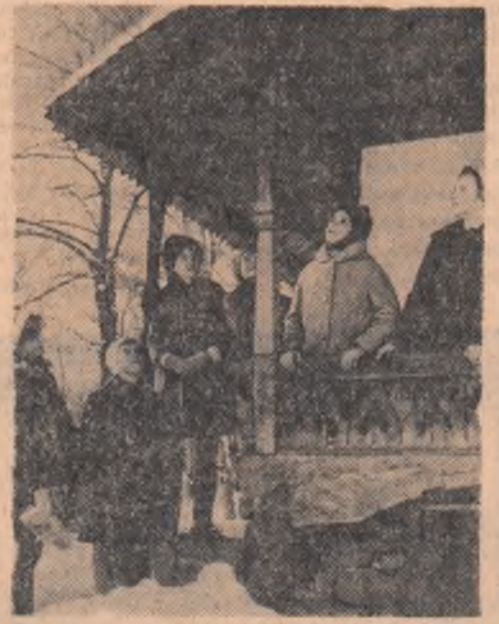
Muzeul satului din București, mijloc de cunoaștere pentru mari și mici

MARIETA VIDRAȘCU (Continuare în pag. a III-a)