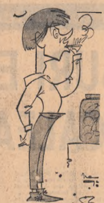
MIHAI IONÎȚĂ (Spiridon) Văzut de NEAGU RĂDULESCU