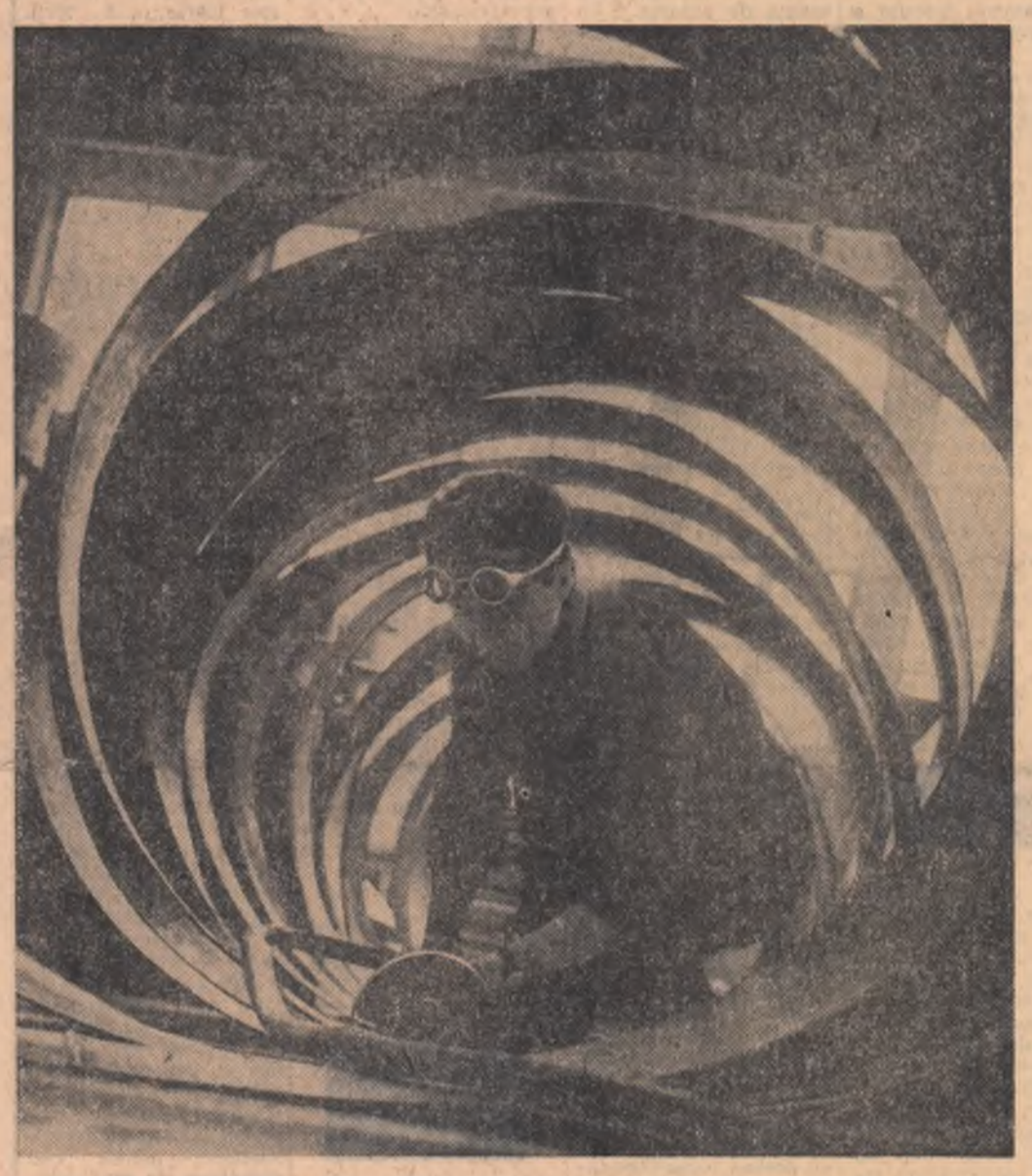
Geometrie Aspect de la Uzina mecanică Timișoara