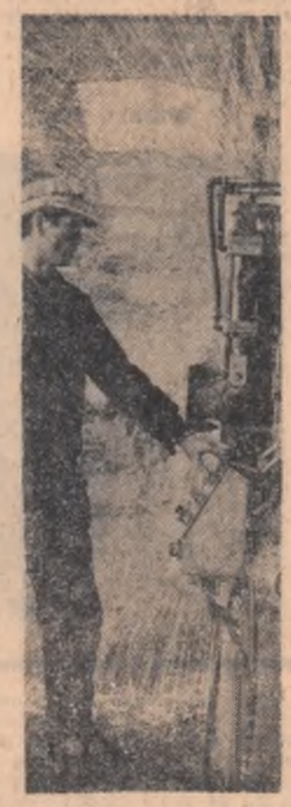
În siderurgie, în construcția de mașini, pe șantiere — metalul poate fi mai bine valorificat. Aceasta este și holdîrea colecției Uzinei metalurgice Iași.

M-am referit mai mult la necesitatea intensificării și amplificării cercetărilor științifice în industria constructoare de mașini, deoarece con-