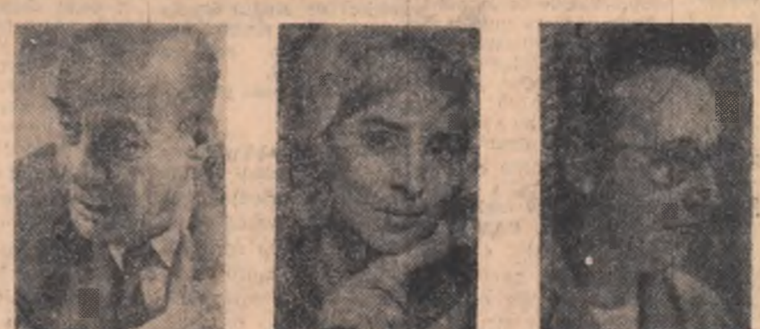
Acad. GR. MOISIL