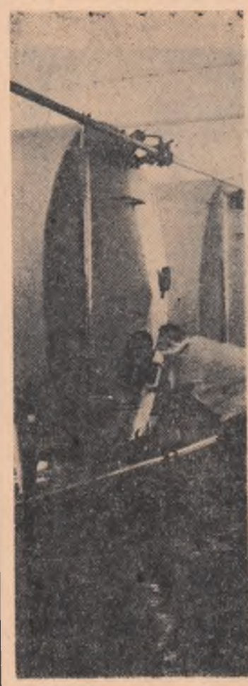
R. F. BULGARIA. — Imagine surprinsă la Fabrica de produse lactate din Sofia