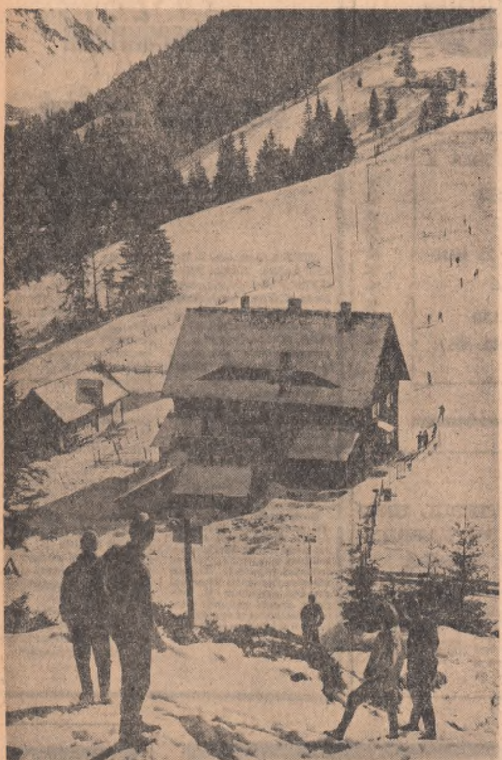
La cabana Dham