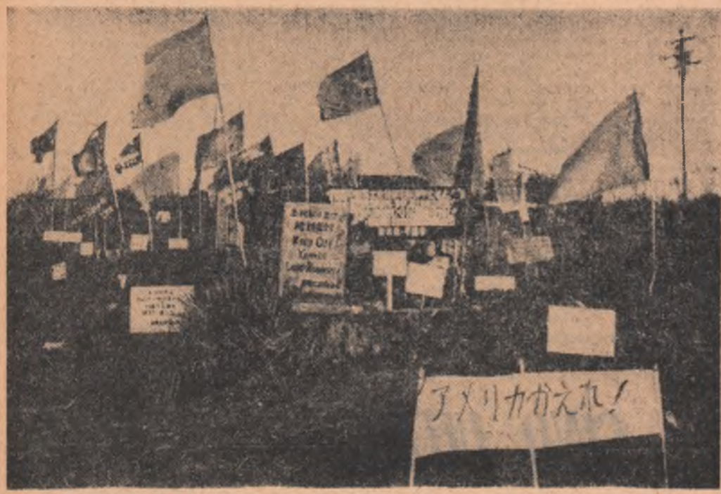
JAPONIA: Demonstrație împotriva prezenței americane la Okinawa