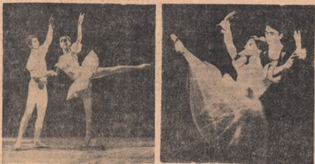
Moment coregrafic — interpretează elevii ai școlii de coregrafe

Sfârșit de săptămână. Ceasul tainic al inserării deschide larg porțile sălilor de spectacol. Pe soarele de marmură ale uncea dintre ele — sala Conservatorului — perechi-perechi, primii spectatori. Sint tineri și foarte tineri. Unora le strălucesc privirile, sint frumoși, sint îndrăgostiți. Cea de-a doua ediție a „Serilor Scintei tineretului” este închinată dragoste.