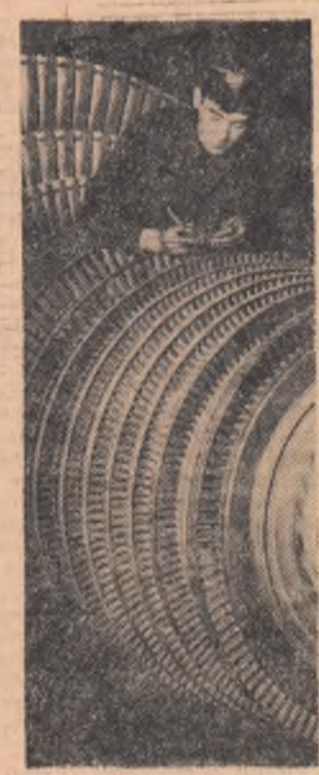
Întreprinderea „Energoreparație” din Capitală. Se lucrează la repararea unui rotor pentru turbine