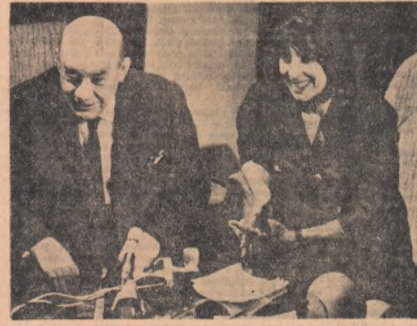
OPINIILE ACAD. GRIGORE MOISIL ȘI ACTRIȚEI CRISTINA TACO

Rep.: O ultimă întrebare. Majoritatea dintre noi reflectînd la marile exemple de iubire, judecăm lucrurile din punctul de vedere al spectatorului aflat în sala de teatru sau de film, al cititorului de literatură. Singurii care dau viață — fie și temporar — acestor exemple de dragoste trăită la mari temperaturi sint artiștii. Ca unii care ați trăit pe scenă ase-menea momente credeți că ele se pot redita în viață?