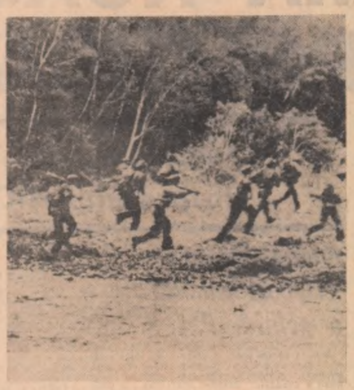
Subunitate a patrioților loajieni într-o misiune de luptă