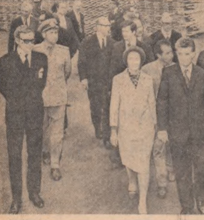
La întreprinderea de prelucrare a lemnului „Kaukas” din orașul Lappeenranta