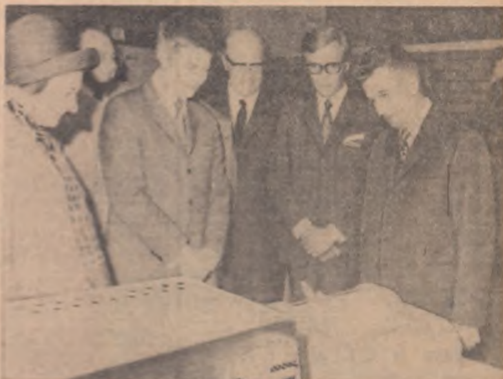
În vizită la Uzina „Enso-Gutzeit” din orașul Imatra