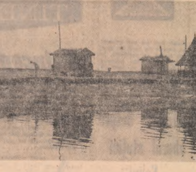
Camping pescăresc la Murighiol

Ziua a V-a Staționare la Calica. Ziua a VI-a Cabana Calica — Cetatea Heraclea (25 km). Ziua a VII-a Heraclea — Capul Iancina — Bisericiuța — Gura Portița (30 km). Ziua a VIII-a Staționare la Portița. Ziua a IX-a Gura Portița — Cabana de pe Grîndul Lupilor (3 km). — Gura Portița. Ziua a X-a Portița — Jurilovca (11 km). Bărcile pot fi transportate cu un camion la Tulcea sau pe calea ferată din Babadag sau Baia. Al doilea traseu. Ziua I Tulcea — Brațul Sf. Gheorghe — Mahmudia (88 km). Ziua a II-a Mahmudia — Cherhanava Dunavăț (54 km). Ziua a III-a Canalul Dunavăț — Gura Dunavățului (28 km). Ziua a IV-a Gura Dunavățului — Lacul Razelm — Insula Popina — Iazurile — Cabana Calica (13 km).