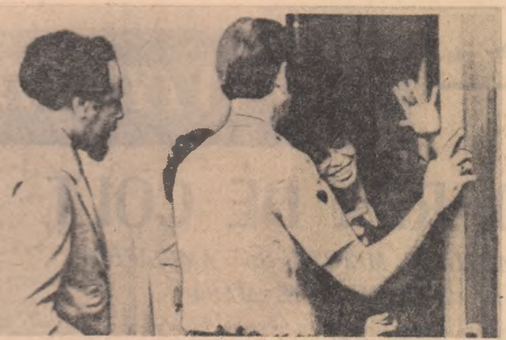
S.U.A. — Tinăra militantă de culoare Angela Davis, condusă recent pentru o nouă audiență la Tribunalul din San Rafael

Conform legii electorale, președintele Indoneziei are dreptul să numească încă 100 de deputați.