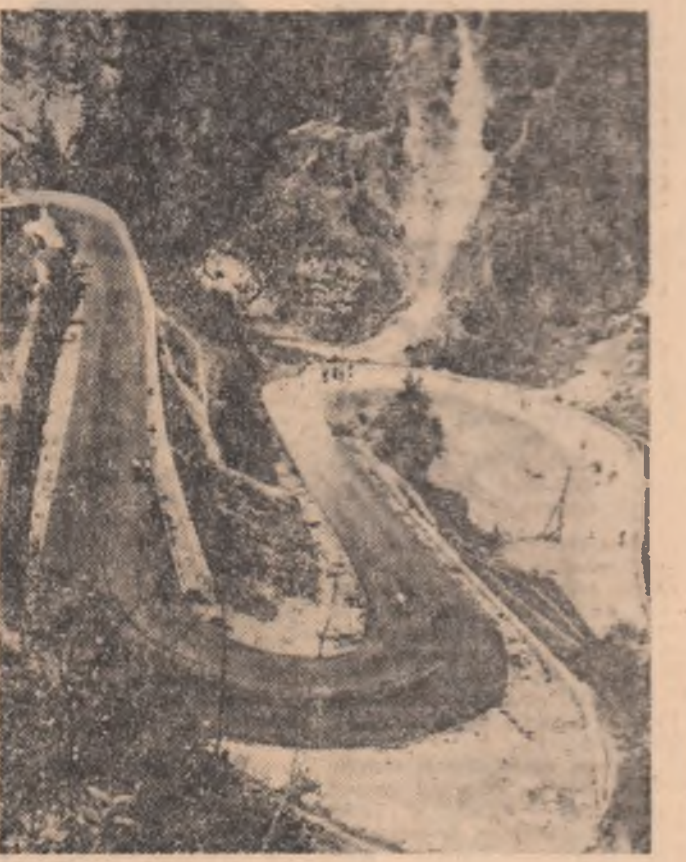
Fără îndoială, temerarii porniți în căutarea „Florii de colț” vor trece și pe serpentinele spectaculoase din apropierea Cheilor Bicazului

18 zile pe coasta dalmată, cu vizitarea Ungariei și Bulgariei, 12 zile pe litoralul bulgar, 15 sau 21 de zile la Soci (U.R.S.S.), iată cîteva excursii deosebit de tentante.