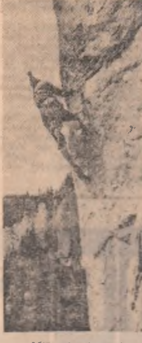
Măiestrie și curaj