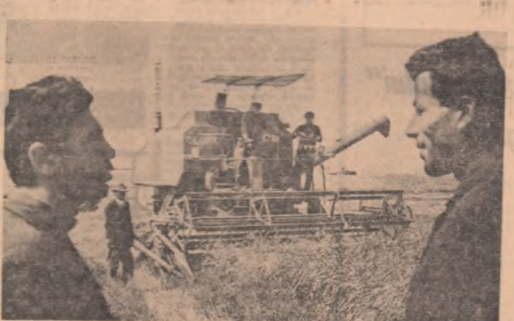
— În alte secții de mecanizare aceste aspecte se află atît de puțin în sfera preocupărilor celor ce au răspundere la multe din aceste direcții. La multe dintre secțiile de mecanizare din județul Teleorman

Apoi, modul în care se aplică recomandările privind conservarea materialelor a tractoriștilor în vederea producției agricole vegetale lasă impresia că ei, mecanizatorii, ar avea o dispoziție mai mare chiar decît inginerii și din C.A.P., șefii de fermă, președinții și oricare dintre membrii cooperativei. Concret: în cazul îndeplinirii sarcinilor de plan, inginerii și cei penalizați cu 15 la sută din salariu lunar