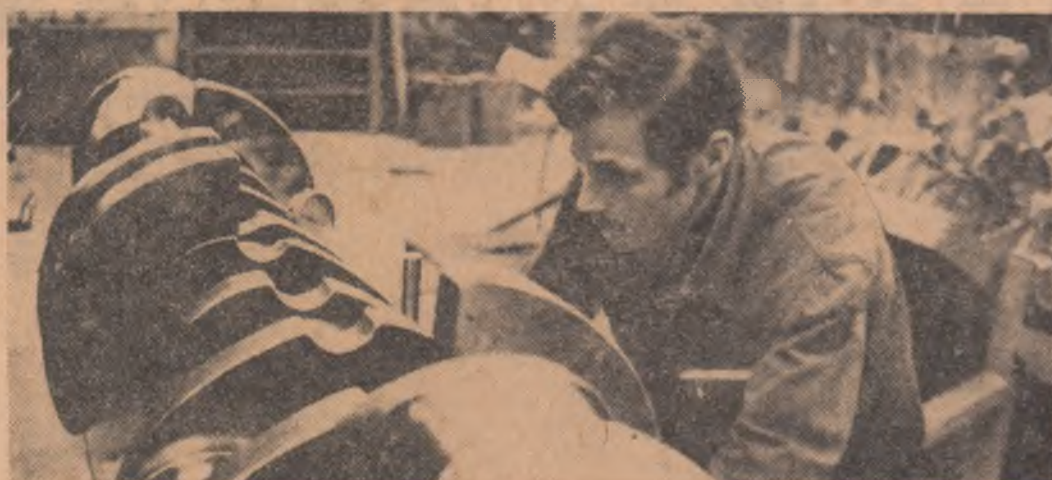
Uzina mecanică de material rulant „16 Februarie” — Cluj.