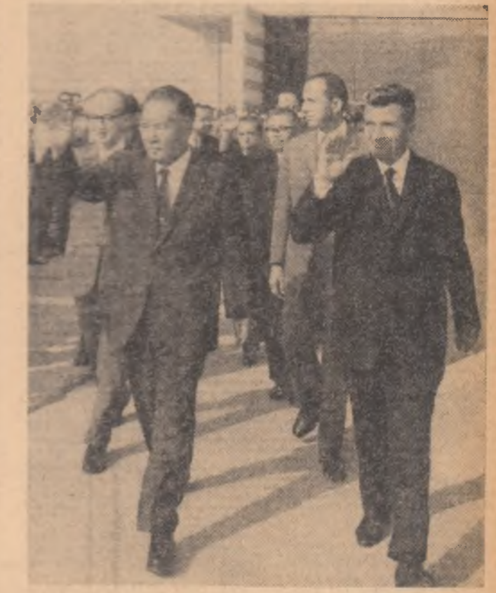
C.C. al P.C.R., prim-adjunct de șef de secție la C.C. al P.C.R., de activități de partid.