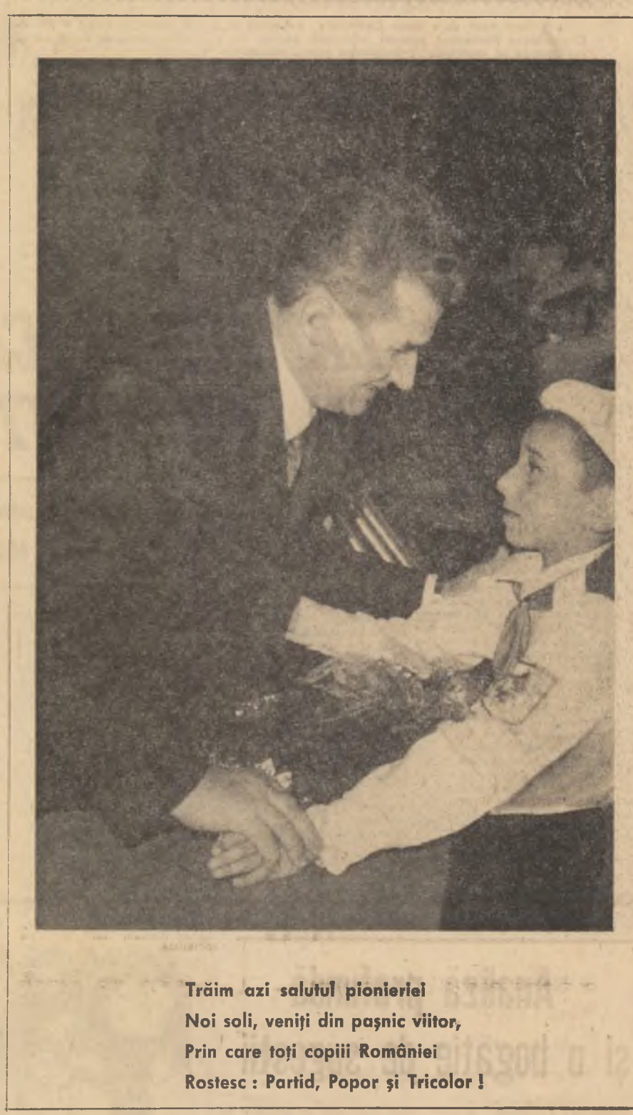
Trăim azi salutul pionieriei. Noi soli, veniți din pașnic viitor, Prin care toți copiii României Rostesc: Partid, Popor și Tricolor!

deschide și mai larg porțile tuturor stadioanelor, bazinelor, patinoarelor și sălilor de sport de care dispunem, vom permanentiza sprijinul tehnic și material în limita posibilităților noastre pentru ca pionierii să beneficieze în mai mare măsură de binefacerile acestor activități.