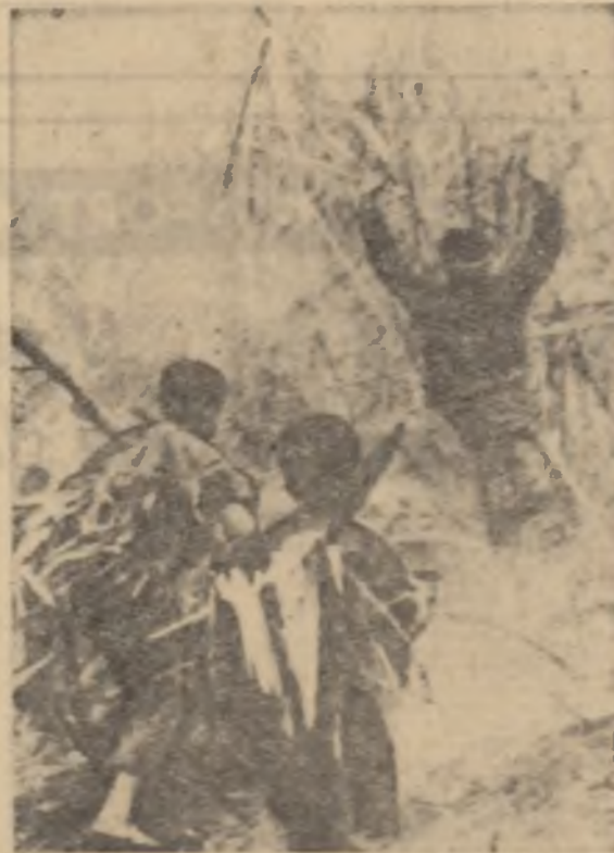
LAOS. — Ostași ai forțelor patriotice de eliberare făcînd prizonier un soldat inamic

MAI MULTE MII de mari-nari și soldați ai armatei terestre din garnizoanele situate în vecinătatea Washingtonului începînd de sîmbătă, au fost alerate. Autoritățile americane au reușit la această măsură pentru a preveni eventuale incidente cu prilejul tradiționalului marș al veteranilor, care se va desfășura, luni, în capitala Statelor Unite.