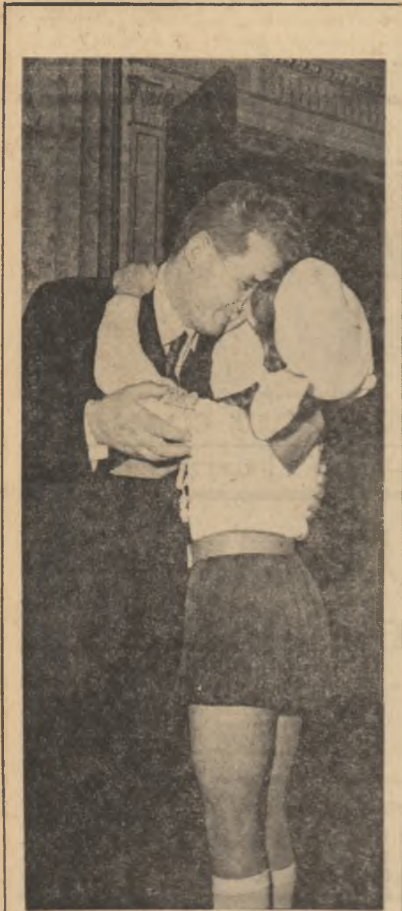
Și dacă-n suflet azi ni se-ntrețoaie Frumos trecut, prezent și viitor, E că ni-i Ceaușescu Nicolae Părinte drag și bun conducător.