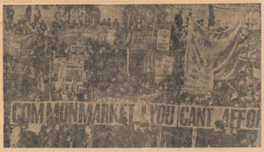
ANGLIA. — Aspect de la o demonstrație de protest împotriva aderării la Piața comună care a avut loc în Piața Trafalgar din Londra.

Comitetul pentru problemele politice și de securitate al Adunării Generale a O.N.U. și-a reluat luni dezbaterile asupra primului punct al ordinii de zi — transparența în practică a declarațiilor asupra securității internaționale. Ambasadorul Braziliei, Sergio Armando Frago, care a luat, primul, cuvîntul la dezbateri, a subliniat că principiile declarate în special cele referitoare la egalitatea suverană a statelor și ne folosirea forței sau a amenințării cu forța, trebuie transpuse în practica relațiilor internaționale de către toate țările. Adjunctul ministrului afacerilor externe al Cehoslovaciei, Milan Klusak, a evidențiat — referindu-se la ameliorarea climatului european — eforturile sta-