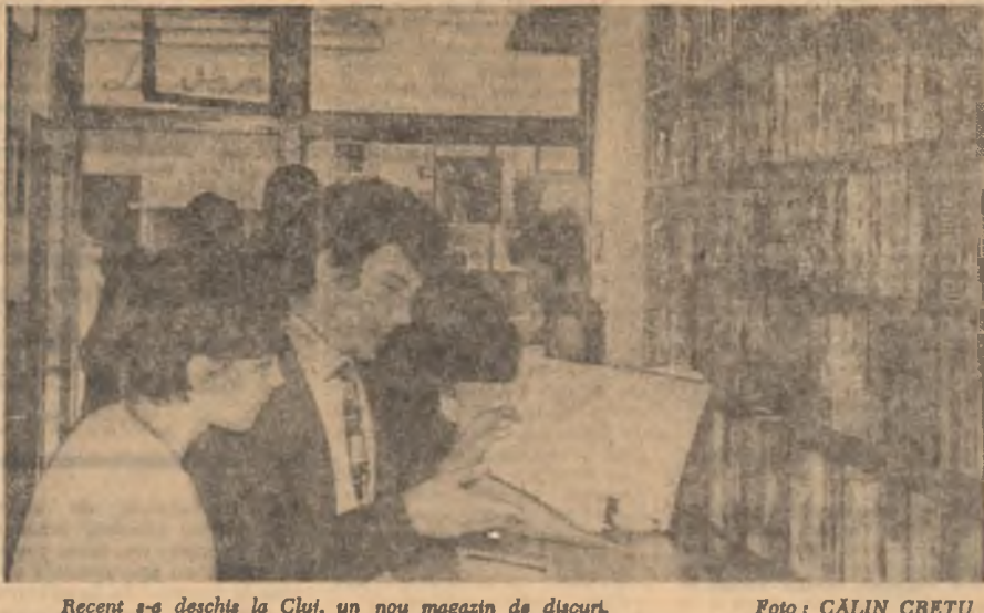
Recent s-a deschis la Cluj, un nou magazin de discuri.