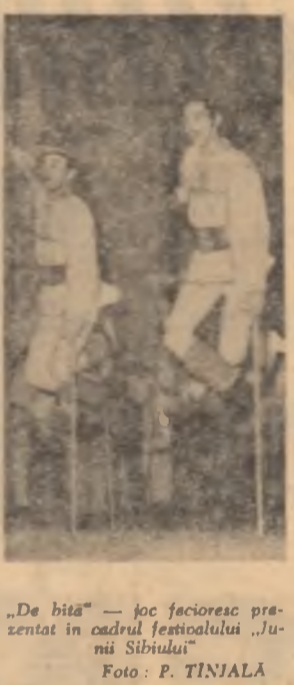
„De bită“ — joc fațosec prezentat în cadrul festivalului „Junii Sibului“

De Teatrul „Creangă“: „Nu-a fost în zadar“ de Al. Miroduan, după romanul cu același titlu de Al. Siperco.