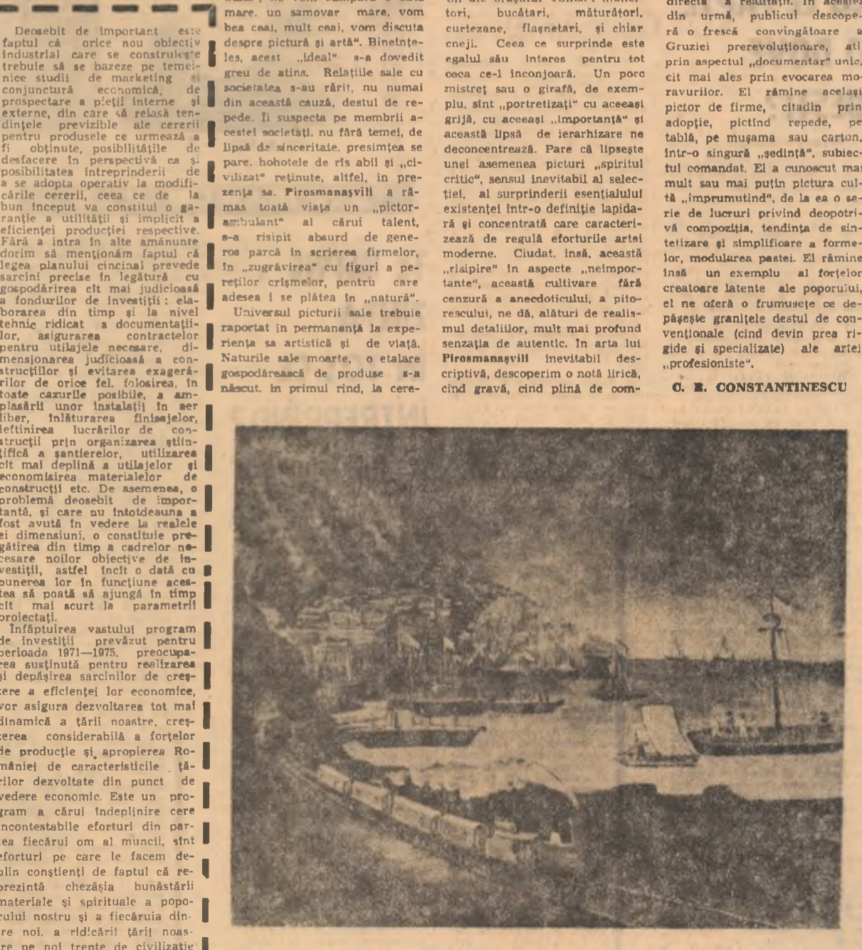
Niko Pirosmanașvili — „Batumi“

Am căta, de pildă, cunoscutul ciclu al „Frumoselor din Ortaci“, curtezane celebre în timpul său.