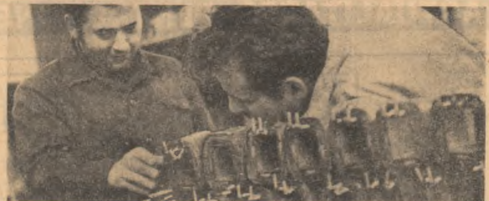
Proletari din toate țările, Uniți-vă!

O inițiativă, o perfectă colaborare între învățămînt și producție au fost traduse în practică la Craiova prin transferarea unor cadre universitare, cu săli de curs și laboratoarele pe platforme economice de mare potențial formativ. Primele momente ale anului universitar în producție sint relatate de reporterii noștri în pagina a III-a