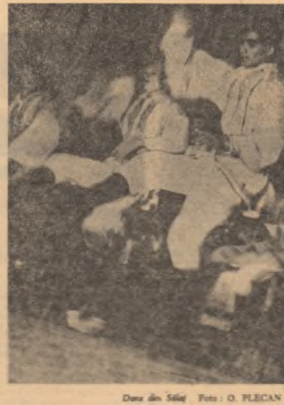
Dans din Sâmb.

se aspect a-zar prezenta ei, poate deveni o adevărată otrăvă spiritală.