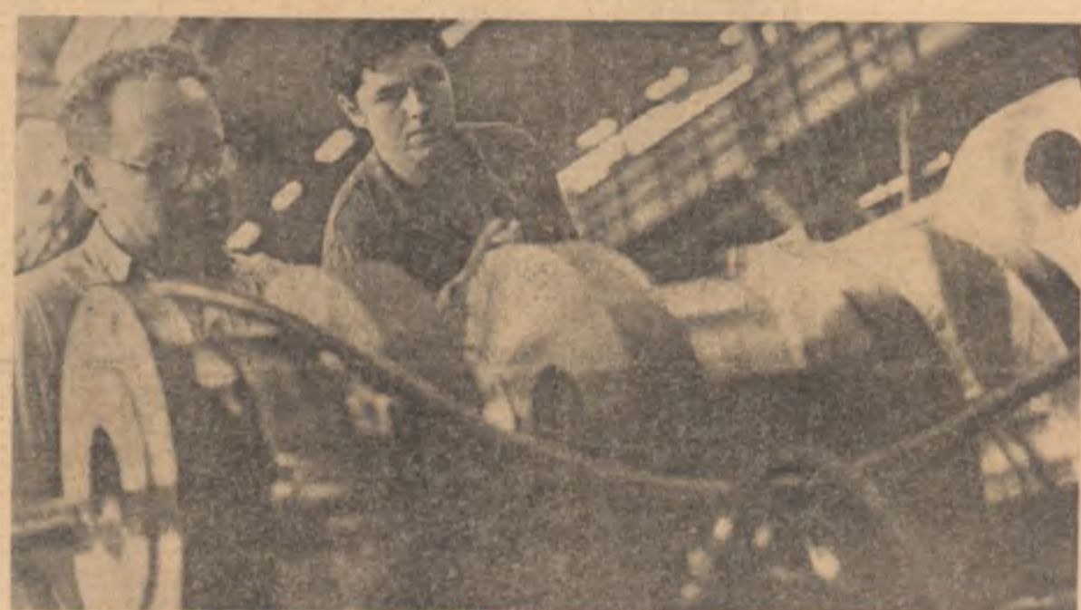
Secția „motoare diesel” — U.C.M. Reșița. Se lucrează la arborele cotit al motorului locomotivei