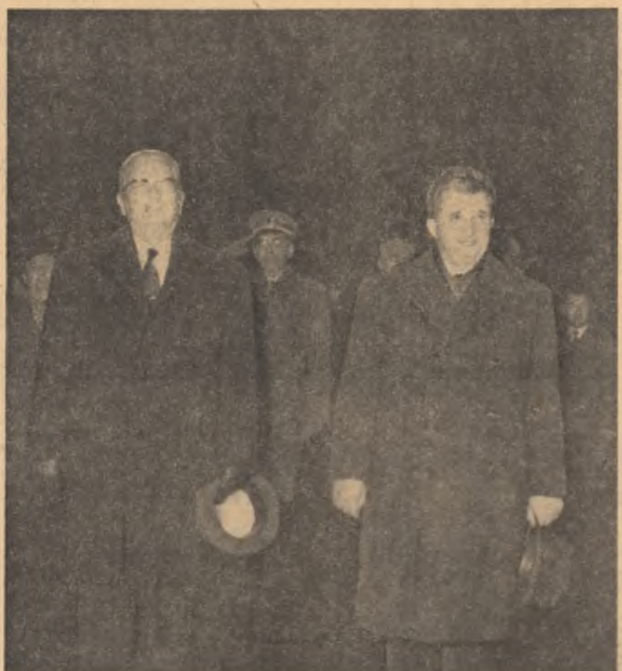
La plecarea, pe peronul gării din Timișoara