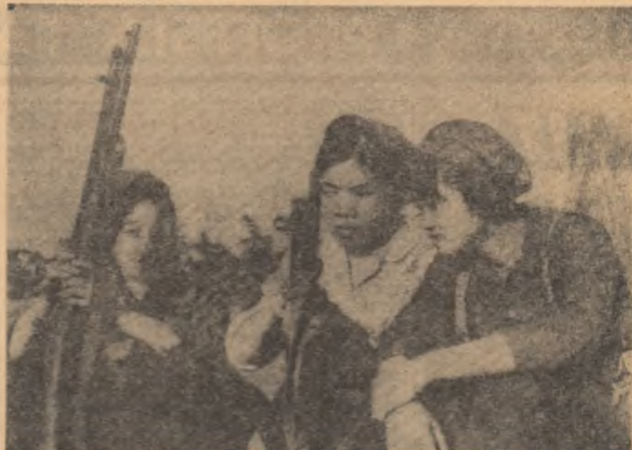
R. D. VIETNAM. — Tinerii muncitori frunzoși de Combinatul textil „S. Marie”, membri ale Uniunii Tineretului Muncitor Ho Și Min, participă din plin la activitatea forțelor de autoapărare a țării.