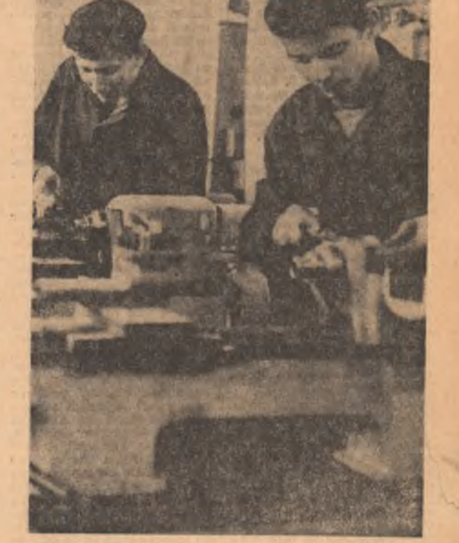
Atelierul de producție mecanică al Grupului școlilor profesional din Arad. În imagine elevi din anul II și III — lucrînd la asamblarea uneltor.

ȘCOALA PROFESIONALĂ OJASCA (comuna Măgura) pe lângă Ministerul Agriculturii, Industriei Alimentare, Silviculturii și Apelor: — mecanic agricol. ȘCOALA PROFESIONALĂ SANITARĂ BUZĂU, str. Cuza-Vodă nr. 63 pe lângă Consiliul popular județean.