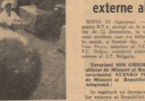
U.R.S.S. — Aspect din secția de fabricație a Fabricii de Împeși electrice din Molinsay

INCEPIND de miercuri, central istoric al „Cetății eterne” va fi închis pentru circulația vehiculelor particulare, ca o primă măsură în cadrul planului de scoatere a traficului rutier al capitalei italiene dintr-o adevărată stare de haos, care s-a agravat mereu în cursul ultimilor ani.