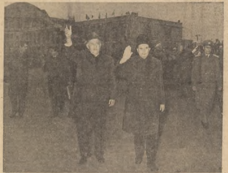
La invitația tovarășului Nicolae Ceaușescu, secretar general al Partidului Comunist Român, președintele Republicii Socialiste

România, vineri după-amiază, a sosit în Capitală, într-o scurtă vizită de prietenie, tovarășul Todor Jivkov, prim-secretar al Comitetului Central al Partidului Comunist Bulgar, președintele Consiliului de Stat al Republicii Populare Bulgaria.