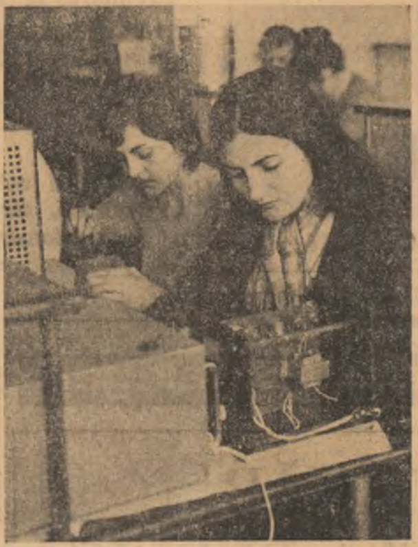
Pasiune și curiozitate, atenție și încordare — iată ce exprimă imaginea de față surprinsă de fotoreporterul nostru în atelierul școlii de electronică al Institutului pedagogic din Bacău