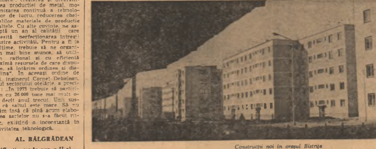
Construcții noi în orașul Bistrița

Pentru a vă socoti participanți la această investigație publicistică inițiată în întimplirea evenimentului de la 9 martie, vi se cere să ne destăinuți în scris gîndurile și aspirațiile, împlinirile pe care cugetul și inima voastră, de tineri ajuși la vîrsta majoratului cetățesc, le au în vedere atunci cînd rostim cunoscutul vers eminescian: Ce-ți doresc eu ție, dulce Românie. Nu uitați, scrisorile prin care se participă la sondajul nostru de opinie sînt așteptate la redacție pînă la data 1 martie a.c.