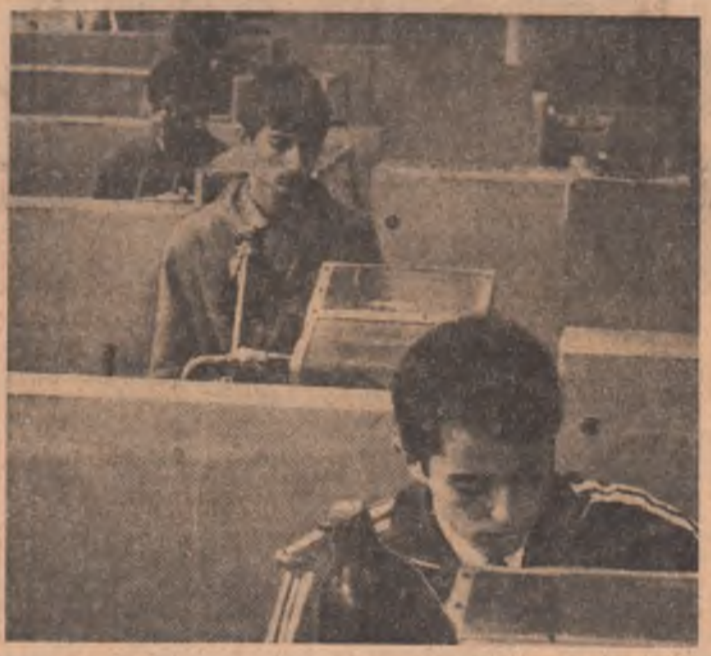
Despre munca și preocupările acestor tineri vă vorbește raportul nostru din pag. a 3-a

Iată și câteva schele cu cele mai bune realizări suplimentare: Brăila — 2319 tone; Videle — 1138 tone; Boldoșii — 1342 tone; Moșoaia-Arges — 1087 tone; Titu — 952 tone; Timișoara — 655 tone. Aceste avansuri substanțiale obținute în primul trimestru dau garanția că petroliștii își vor respecta întocmai angajamentul patriotic de a îndeplini cincinalul înainte de termen.