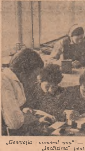
„Generația numărul unu” — elevii de școala generală — face „încălzirea” pentru a deveni liceeni.